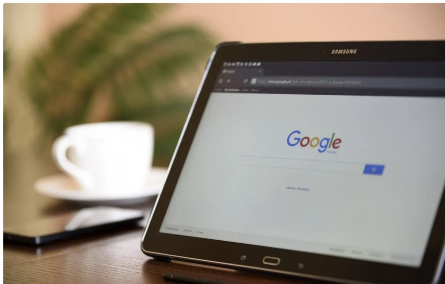
Google va flouter par défaut les images explicites sur son moteur de recherche (illustration).

INTERNET · Google va imposer un floutage des images explicites même chez ceux qui n'ont pas activé l'outil SafeSearch