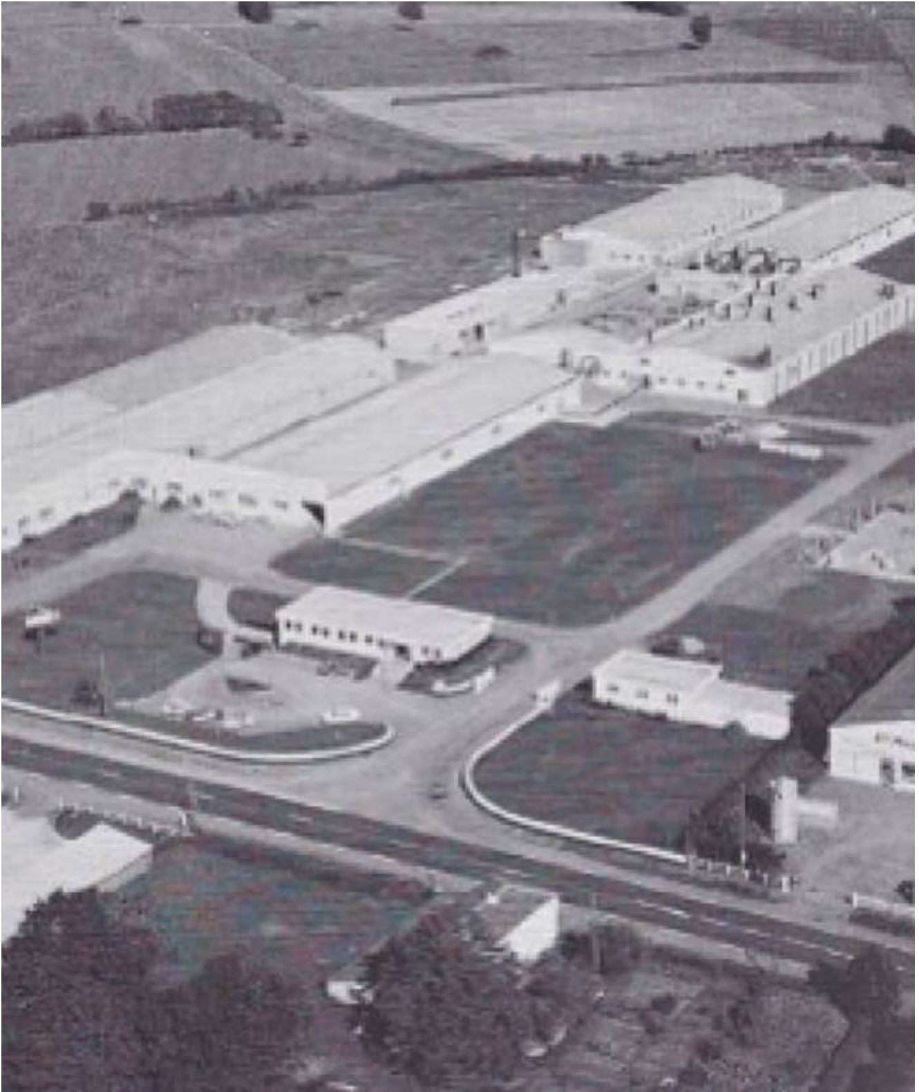
Vue aérienne du site de Chantonay – 1975