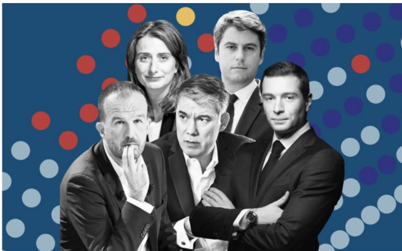
Le second tour des élections législatives a eu lieu ce dimanche 7 juillet. DA Le Parisien

écrit par Christine Tasin | 8 juillet 2024