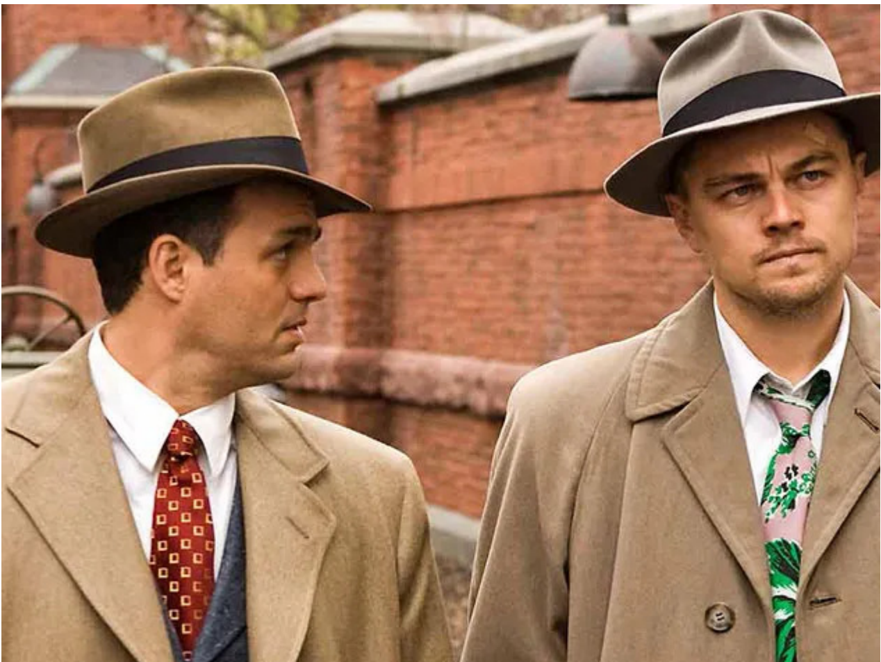
Shutter Island avec Leonardo DiCaprio