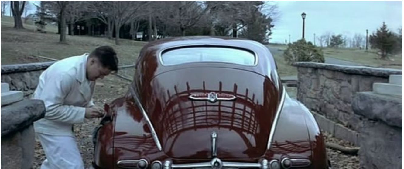
La Buick Roadmaster (1947) dans le film Shutter Island