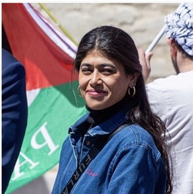
Rima Hassan en avril 2024.