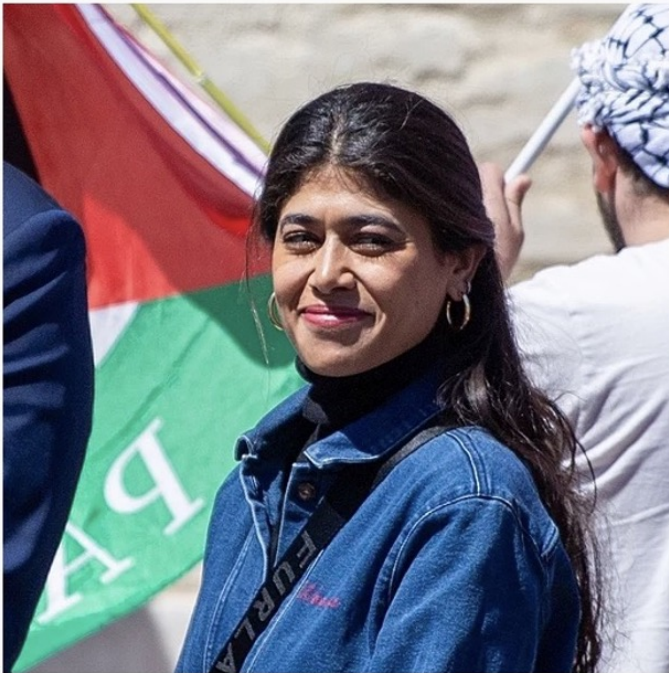
Rima Hassan en avril 2024.