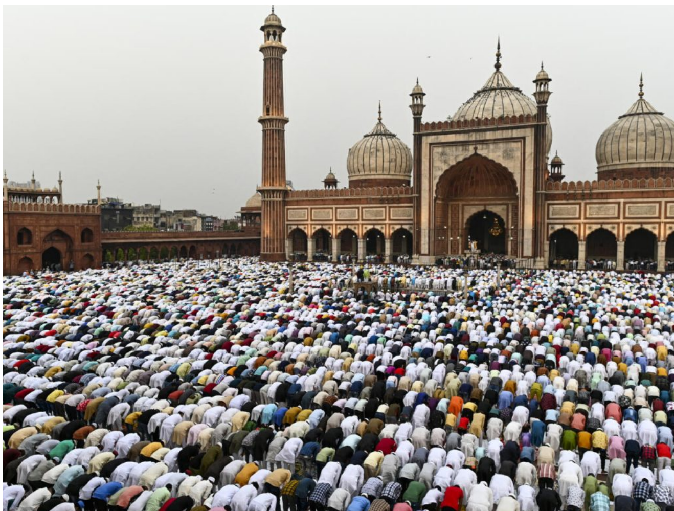
Une mosquée en Inde

►Un hindou battu en meute pour avoir osé se déplacer avec une collègue musulmane...(Inde)