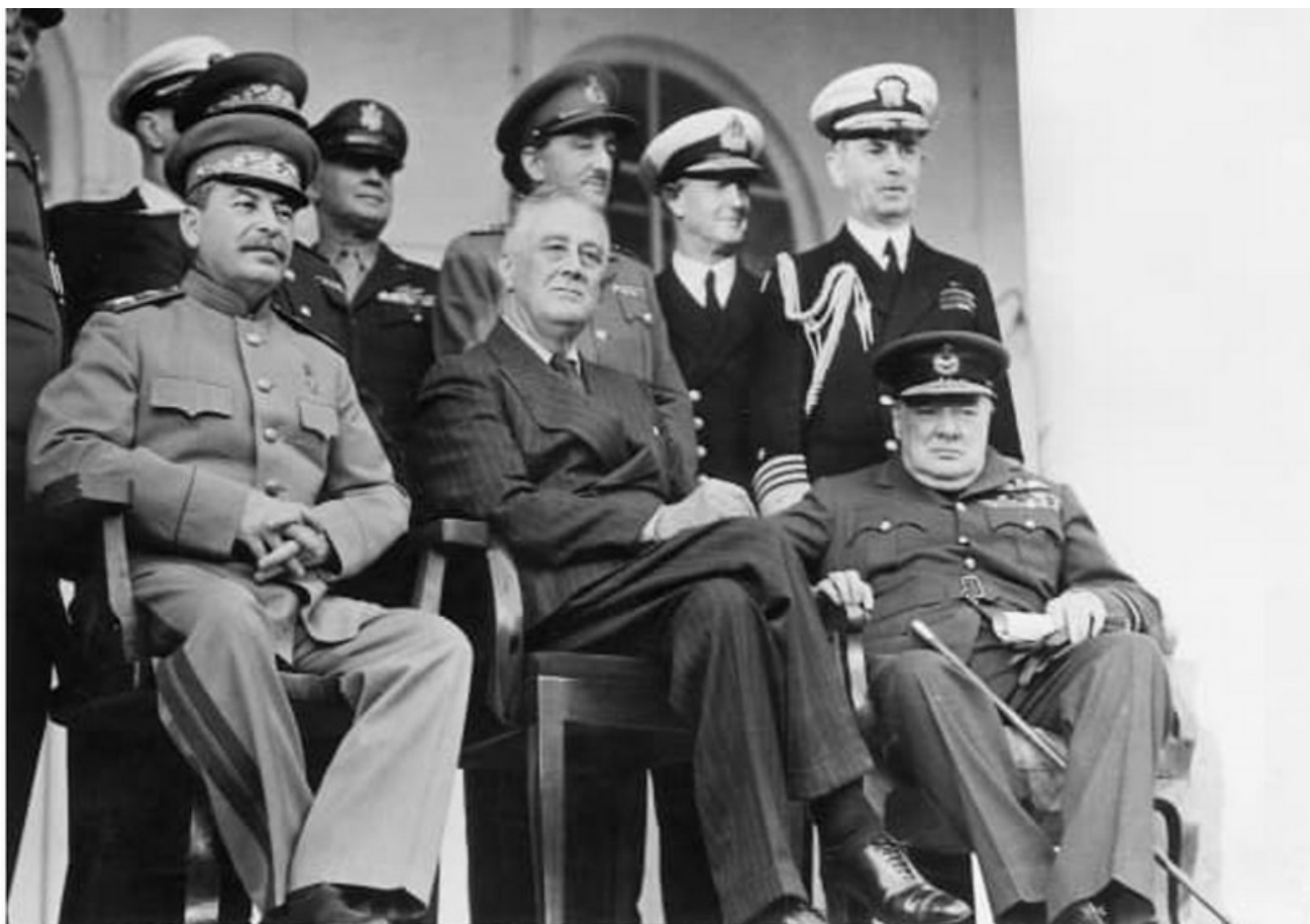
Conférence de Téhéran, 28 novembre 1 er décembre 1943

Faut-il lui rappeler, au grand morveux, que le débarquement de 1944 fait suite à une demande de l'URSS ? C'est Staline qui l'a formulée à Churchill et Roosevelt lors de la conférence de Téhéran (28 novembre – 1 er décembre 1943).