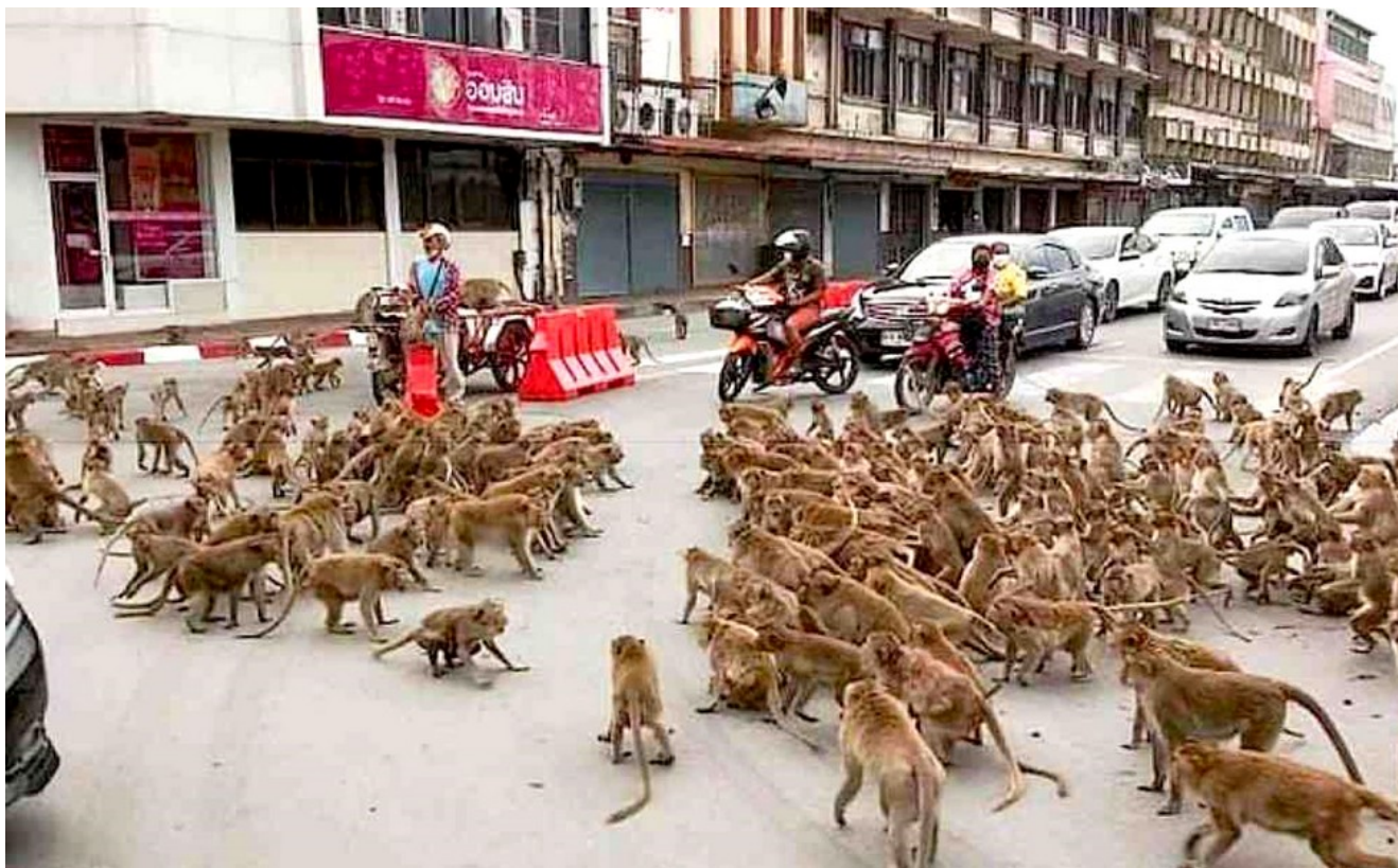
Bagarre entre bandes rivales de macaques dans une rue de Lopburi

Selon la presse thaïlandaise, le macaque voleur de lingerie a causé une grande détresse dans la région, perturbant grandement les commerces locaux.