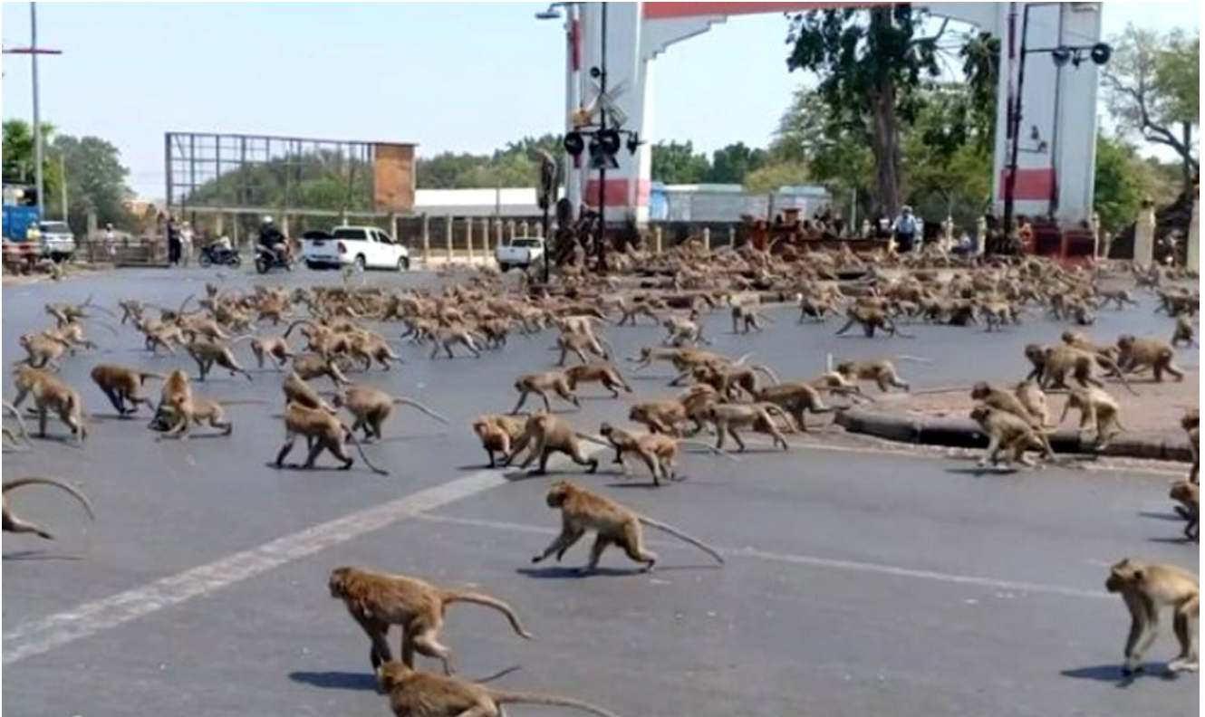
Macaques envahissants à Lopburi – Thaïlande

Un singe recherché pour de multiples vols de lingerie vient d'être arrêté dans la célèbre ville Lopburi dans le centre de la Thaïlande.