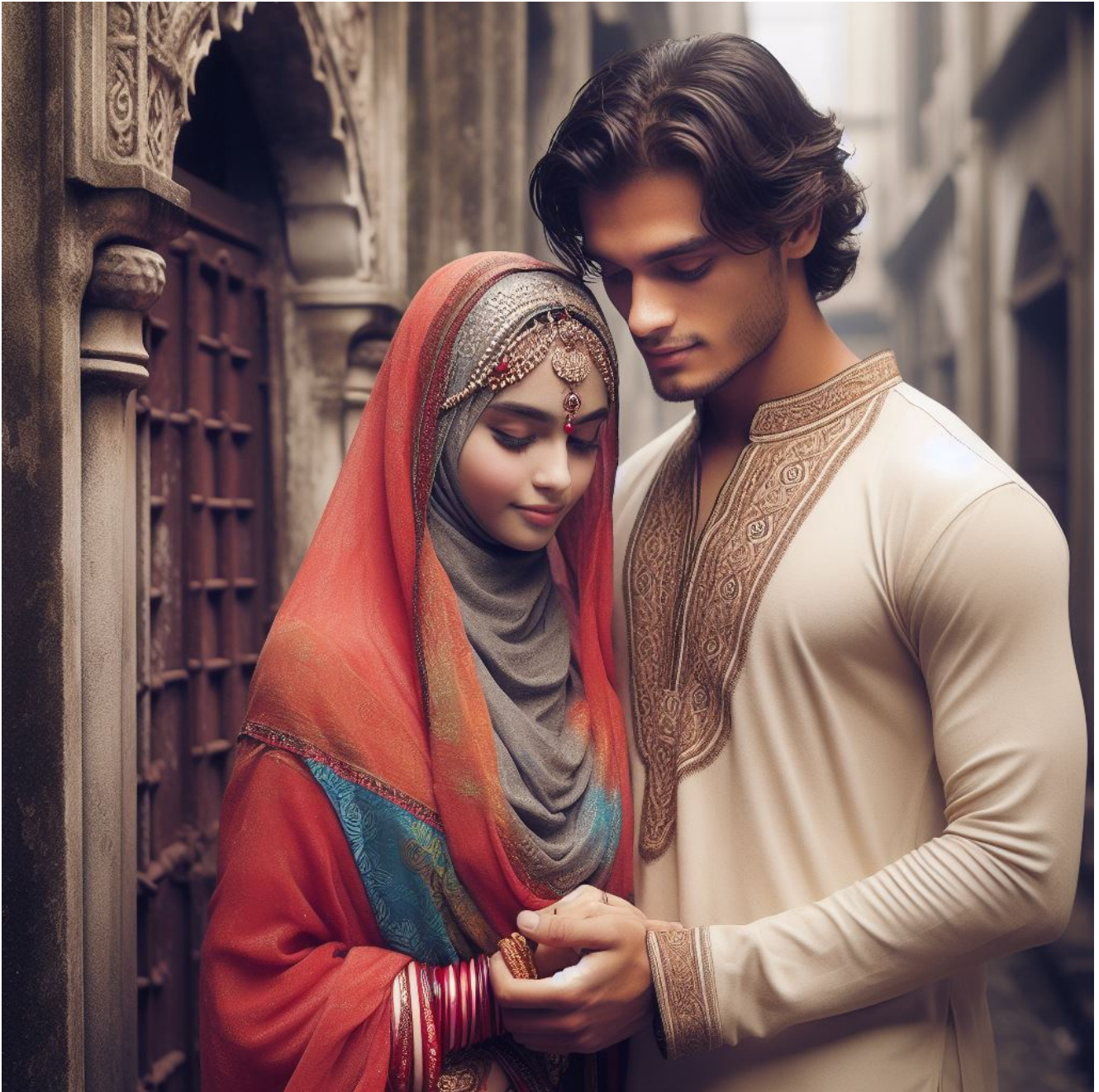
Image interdite en islam, religion « d'Amour, de Tolérance et de Paix » : une jeune musulmane amoureuse d'un Hindou (illustration créée par Résistance républicaine avec l'IA)