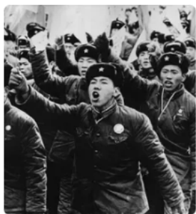
Armée populaire de libération

Le Parti communiste chinois a voulu créer une puissante force militaire de sa stratégie guerrière et révolutionnaire. Il a donc instauré l'Armée rouge le 01/08/1927 d'autant plus qu'il entrait en guerre civile contre le Kuomintang 1 . Elle fut ensuite rebaptisée Armée populaire de libération (ou Armée de libération du peuple, A.L.P.) en 1946). Cette armée était composée d'éléments nationalistes passés aux communistes et de membres du parti communiste chinois.