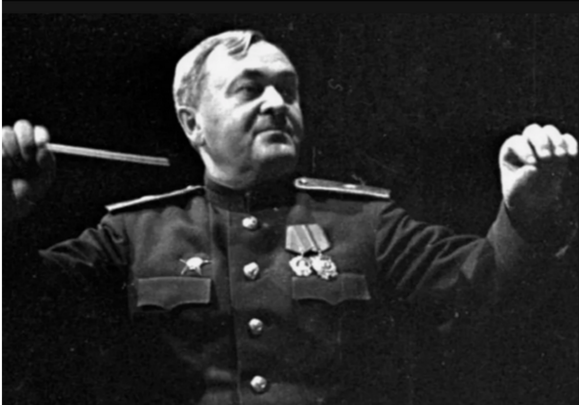
Alexandre Alexandrov (1883-1946)

Alexandre Alexandrov a tellement marqué son époque au niveau choral, composition, et surtout comme créateur de l'ensemble, qu'à sa mort la dénomination officielle des Chœurs de l'Armée rouge est devenue les "Chœurs de l'Armée rouge Alexandrov" et continue de porter actuellement ce nom.