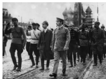
Trotski et l'Armée rouge

Le 21 février, devant la poursuite de l'avance allemande, la patrie socialiste est déclarée en danger et commence l'inscription en masse des volontaires. C'est à Trotski que revient la tâche d'organiser et de structurer la nouvelle armée. En juillet 1918, lors de la guerre civile, on décrète la mobilisation générale des hommes de dix-huit à quarante ans.