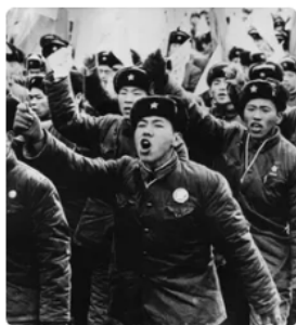
Armée populaire de libération

Le Parti communiste chinois a voulu créer une puissante force militaire de sa stratégie guerrière et révolutionnaire. Il a donc instauré l'Armée rouge le 01/08/1927 d'autant plus qu'il entrait en guerre civile contre le Kuomintang 1 . Elle fut ensuite rebaptisée Armée populaire de libération (ou Armée de libération du peuple, A.L.P.) en 1946). Cette armée était composée d'éléments nationalistes passés aux communistes et de membres du parti communiste chinois.