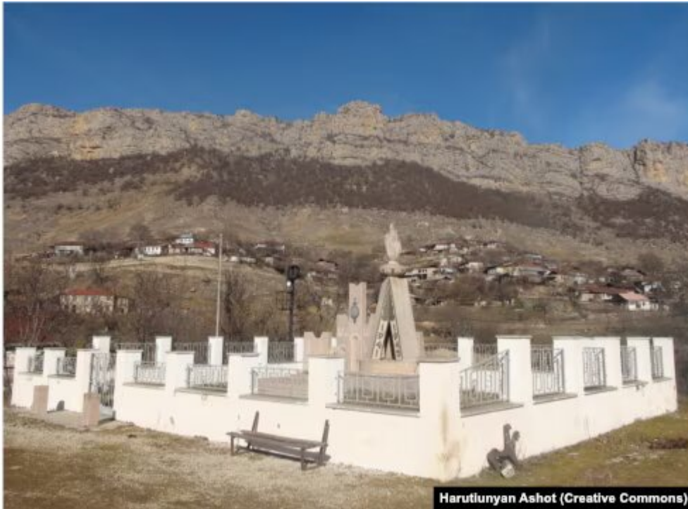
Un mémorial de la Seconde Guerre mondiale à Dasalti/Karintak photographié en janvier 2015.