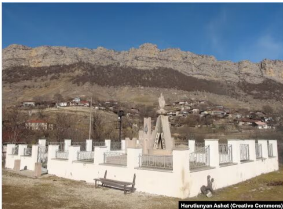
Un mémorial de la Seconde Guerre mondiale à Dasalti/Karintak photographié en janvier 2015.