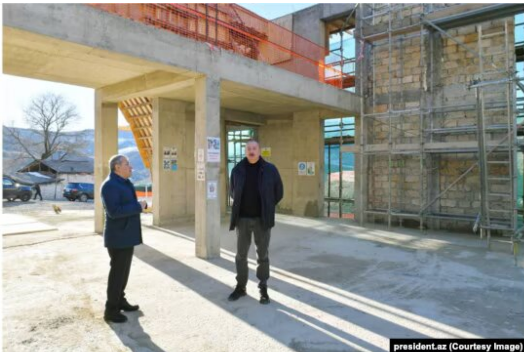
Le président azerbaïdjanais Ilham Aliyev (à droite) visitant le chantier de la mosquée de Dasalti/Karintak en décembre 2023.