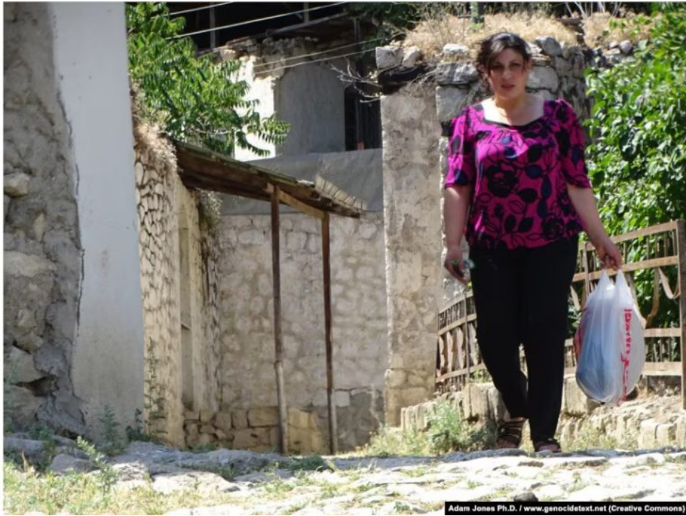
Une habitante arménienne se promène à Dasalti/Karintak en juin 2015.