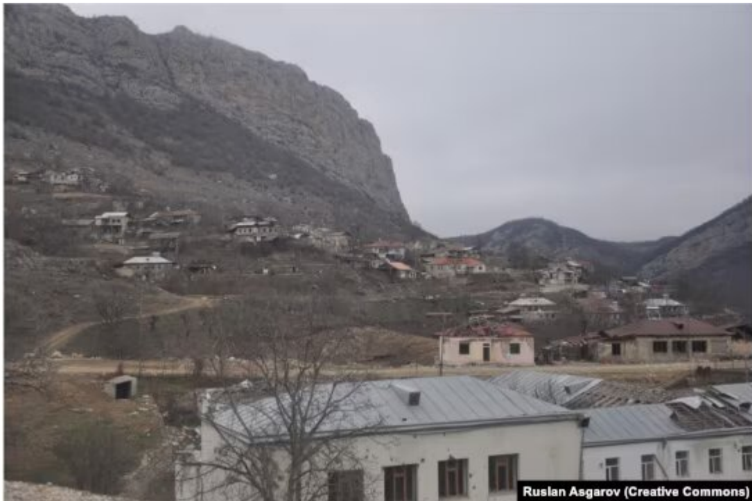
Impacts de balles sur la façade de l'école de Dasalti/Karintak (au premier plan) en décembre 2021.