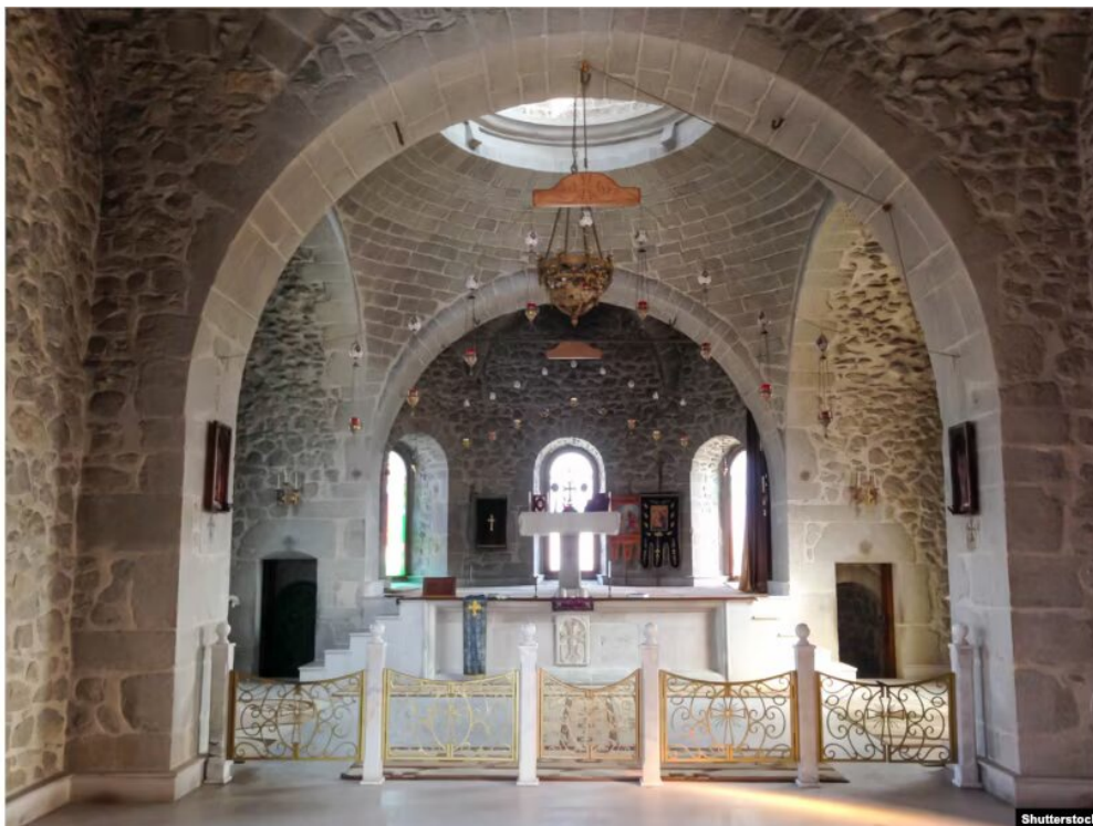
L'intérieur de l'église Saint-Jean-Baptiste de Suse, qui a été détruite ces derniers mois.

► L'évêque agressé dans l'église de Sydney soutient la position d'Elon Musk