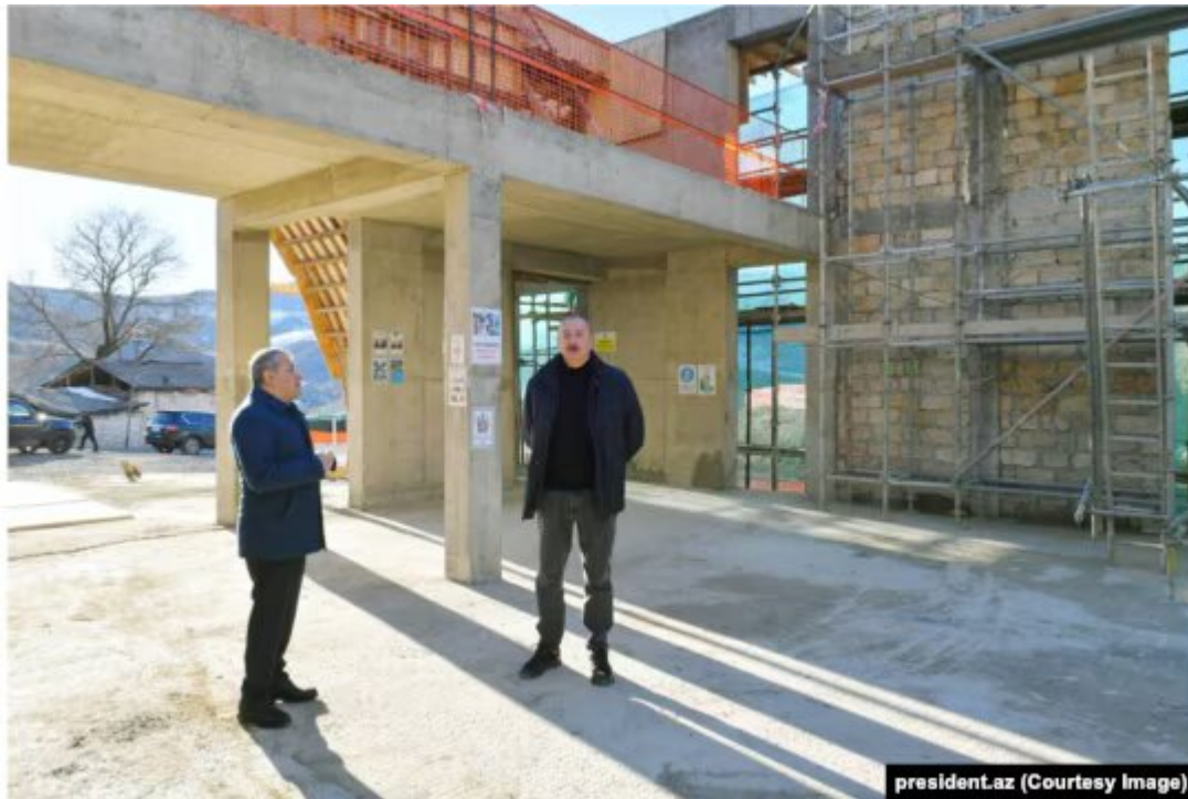
Le président azerbaïdjanais Ilham Aliyev (à droite) visitant le chantier de la mosquée de Dasalti/Karintak en décembre 2023.