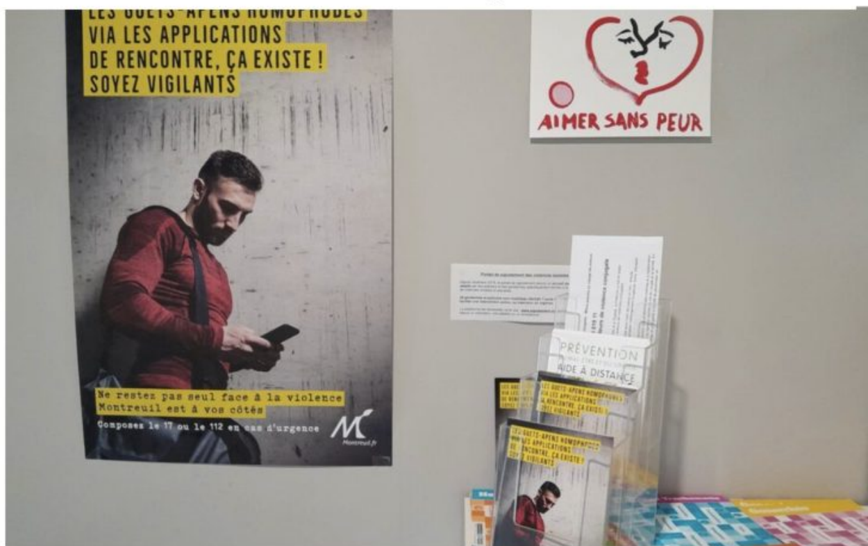
Montreuil (Seine-Saint-Denis), ce mardi. Après trois agressions survenues cette année dans la ville, la municipalité déploie une campagne de prévention pour lutter contre les guets-apens homophobes sur les applis de rencontre.

Passage à tabac et meurtre des nôtres, homos ou hétéros, via les sites de rencontre : c'est la marque de l'islam.