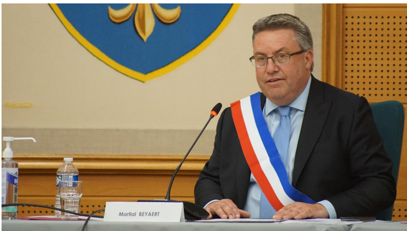
Martial Beyaert maire PS de Grande-Synthe.