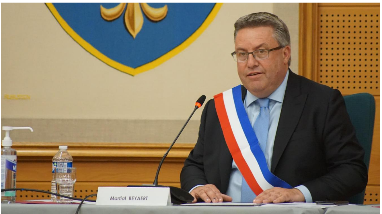
Martial Beyaert maire PS de Grande-Synthe.