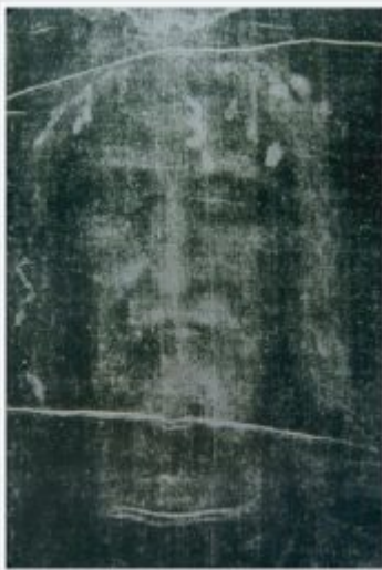
Négatif du visage du linceul de Turin (1898).

Par ailleurs, « la probabilité que des affabulateurs médiévaux aient réussi à falsifier à la fois le Suaire de Turin , le Suaire d'Oviedo et la Tunique d'Argenteuil en y déposant du sang de type AB est de (1/20)^3 , c'est-à-dire 1/8000 = 0,000125 .