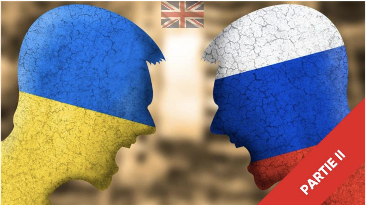
Le conflit russo-ukrainien : un plan globaliste bien huilé ? Partie II

Je vous invite à lire sur France soir 2 articles passionnants et plutôt exhaustifs sur Ukraine-Russie et le rôle central des USA aux manettes.