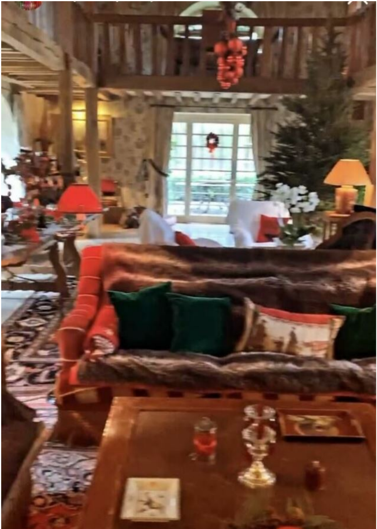
A Noël 2020, le couple Tapie se reposait au Moulin du Breuil à Combs-la-ville en Seine-et-Marne.