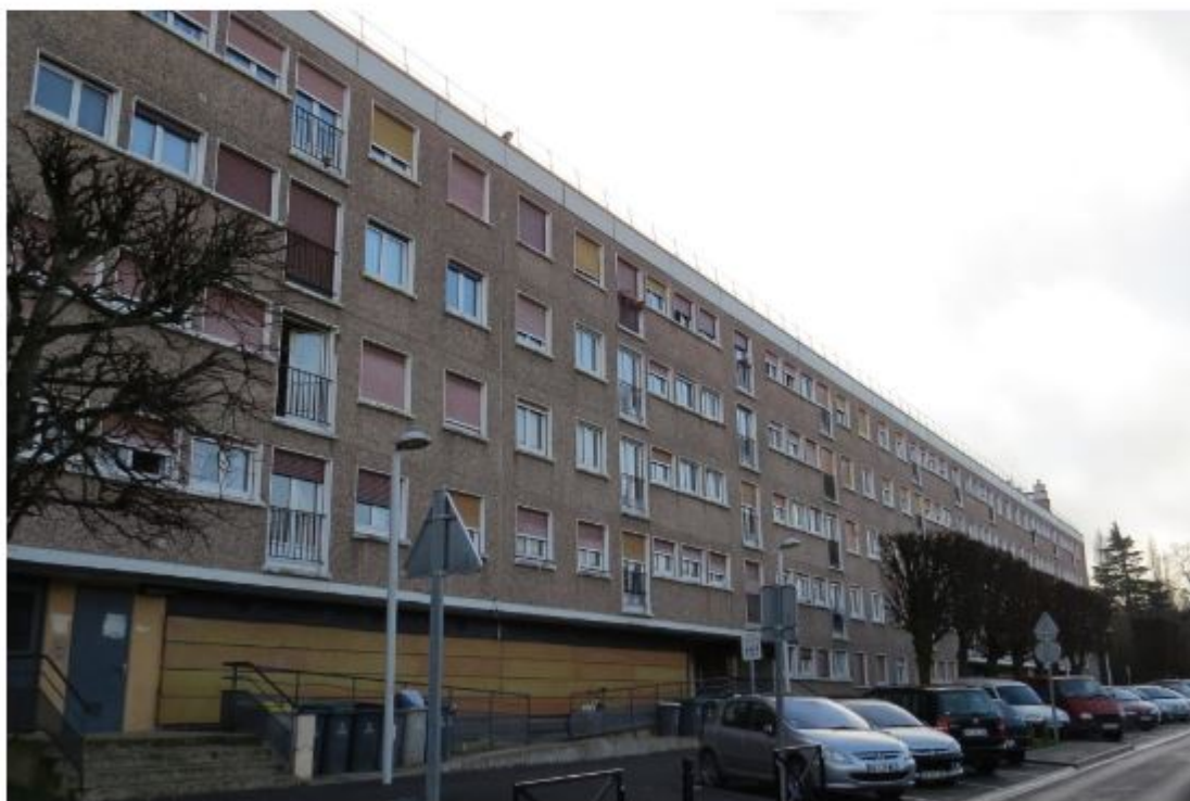
La Cité du Parc de Moissy-Cramayel est connue pour être un point de deal

Les policiers ont fait une descente à la Cité du Parc de Moissy-Cramayel, connue pour être un point de deal. Trois suspects - dont une femme - ont été interpellés.