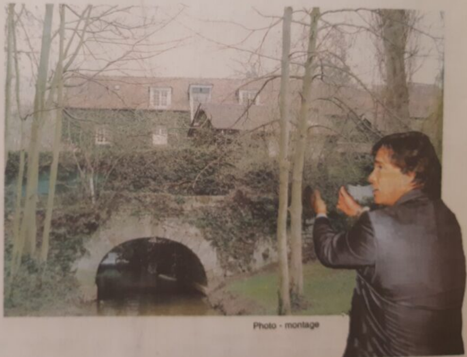
Photo - montage

Le Moulin-du-Breuil est une des plus belles propriétés de Combs-la-Ville. Située à cheval sur la Seine-et-Marne et l'Essonne, elle enjambe l'Yerres et offre ses 3,4 hectares en pente douce. C'est dans ce cadre superbe que Bernard Tapie vivra prochainement. Le Moulin-du-Breuil a été racheté dernièrement par une société britannique dont l'ancien président de l'O.M. est le consultant. L'ensemble était mis à prix entre 13 et 15 millions de Francs. De quoi se mettre "au vert" cet été.