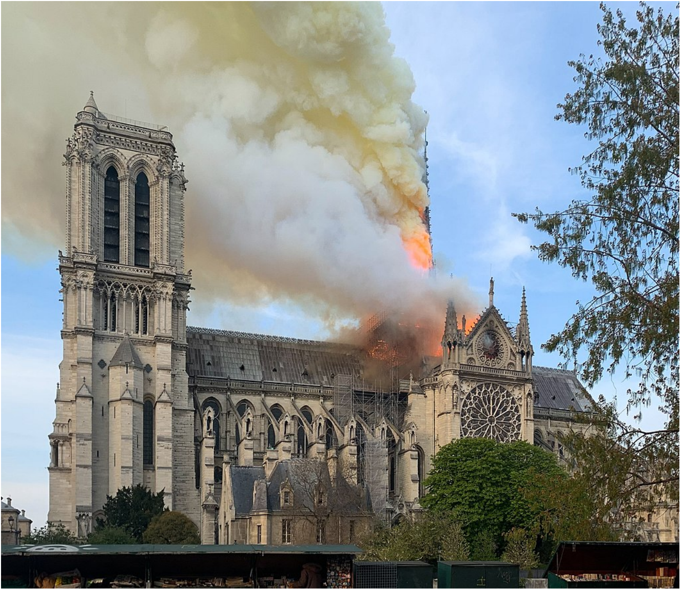
Photo : la cathédrale Notre-Dame de Paris en feu, le 15 avril 2019, toiture et flèche s'embrasent à 19 h 17.

On sait bien qu'il n'y a que les mégots de cigarette qui s'en prennent à Notre-Dame : n'est-ce pas, Macron ?