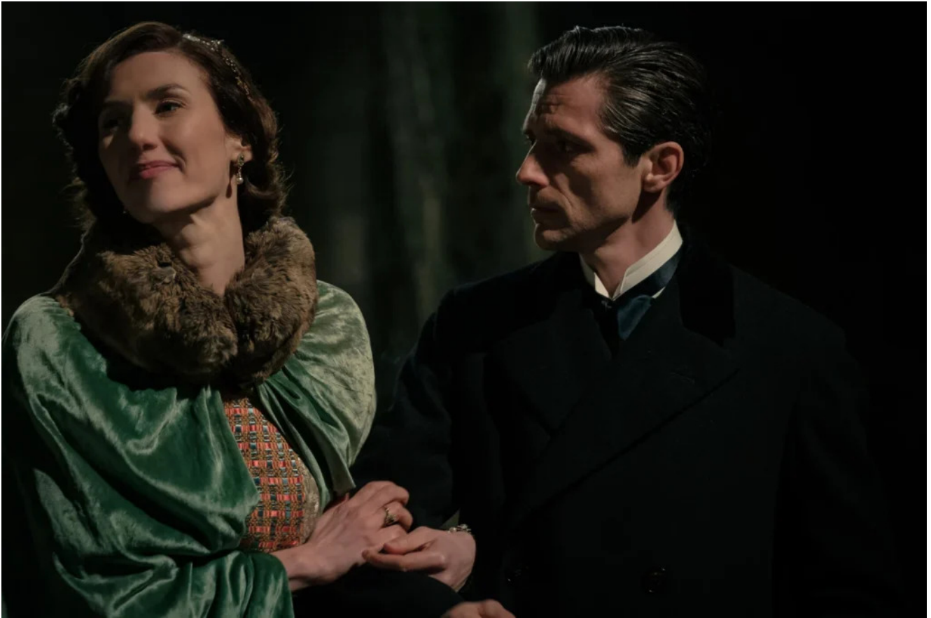
Doria Tillier incarne l'amour secret de Maurice Ravel.