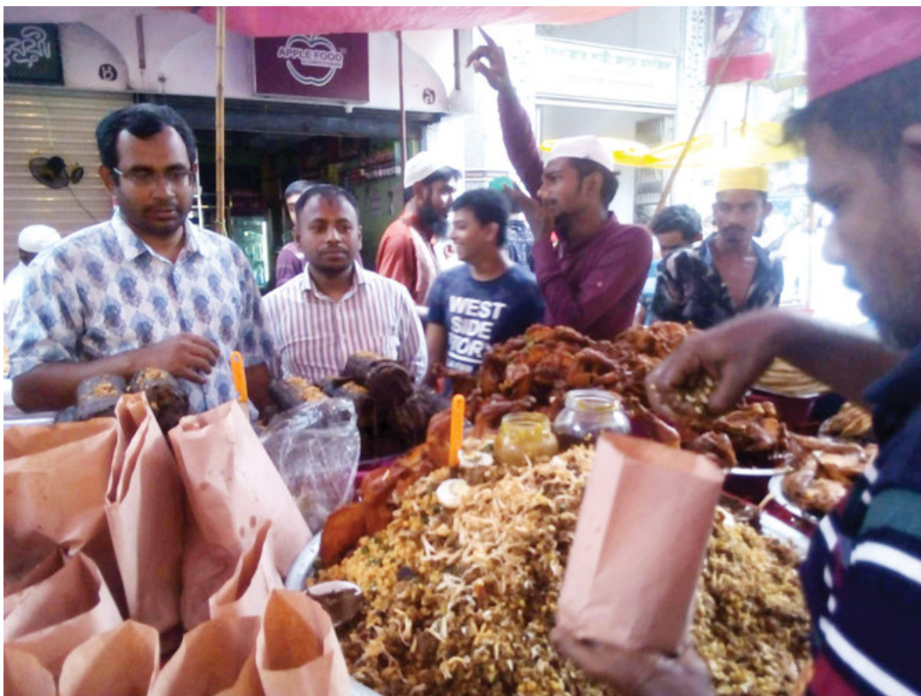
Illustration : le ramadan au Bangladesh

Le Bangladesh est un pays musulman, mais le restaurateur avait peut-être l'intention de s'adresser aux hindous et à d'autres personnes pendant le ramadan. Pour la foule islamique, cela n'était pas autorisé.