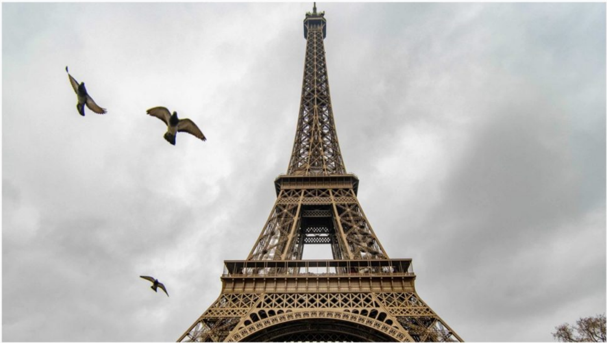
La Tour Eiffel est-elle menacée ?