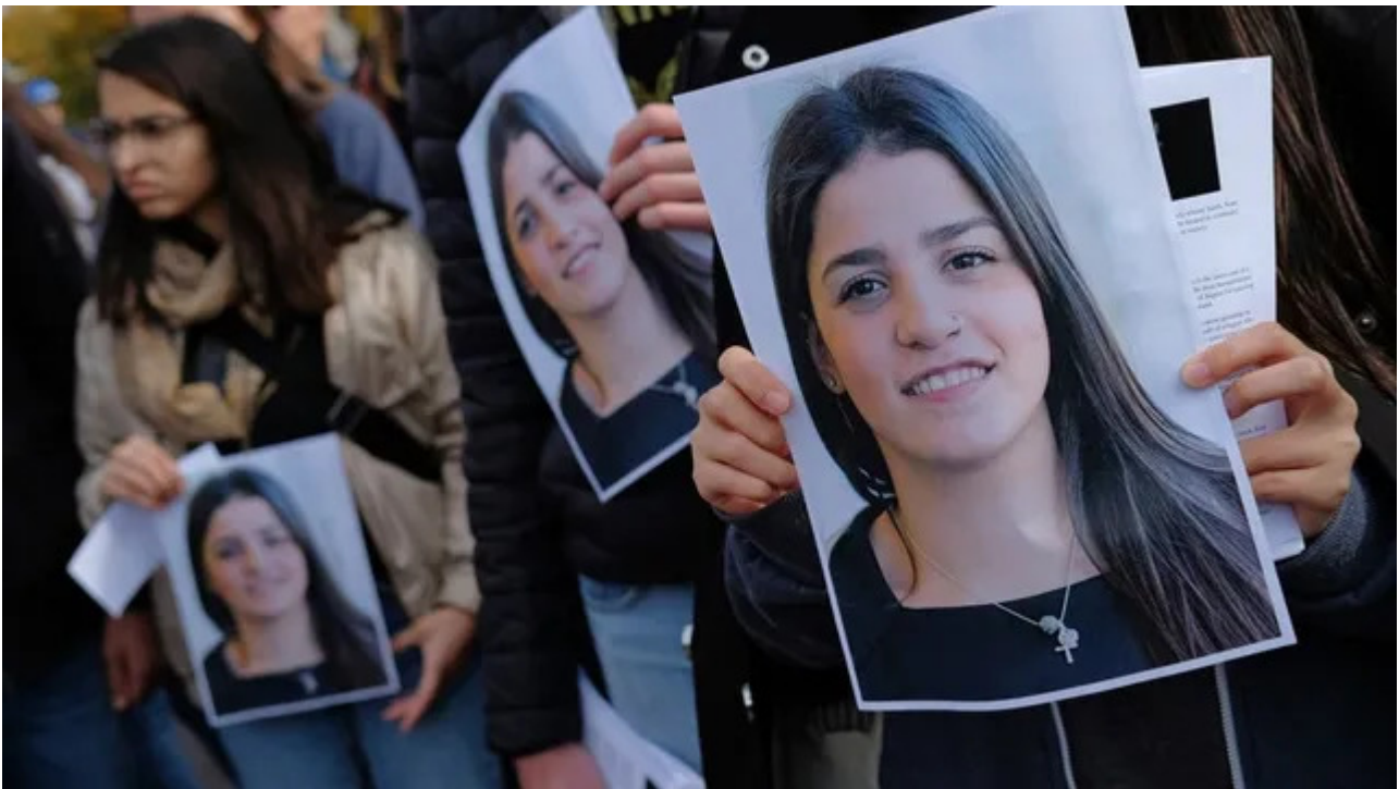
Photo de la jeune Irlandaise violée par le Syrien.