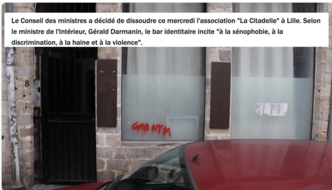
Le siège du bar la Citadelle à Lille

Le Conseil des ministres a décidé de dissoudre ce mercredi l'association "La Citadelle" à Lille. Selon le ministre de l'Intérieur, Gérald Darmanin, le bar identitaire incite "à la xénophobie, à la discrimination, à la haine et à la violence".