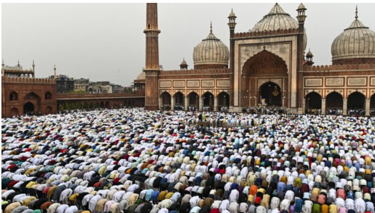
La mosquée Jama Masjid à New Delhi

► Les services de sécurité indiens démantèlent une cellule de recrutement de djihadistes se vantant d’imposer “l’autorité islamique d’ici 2047”