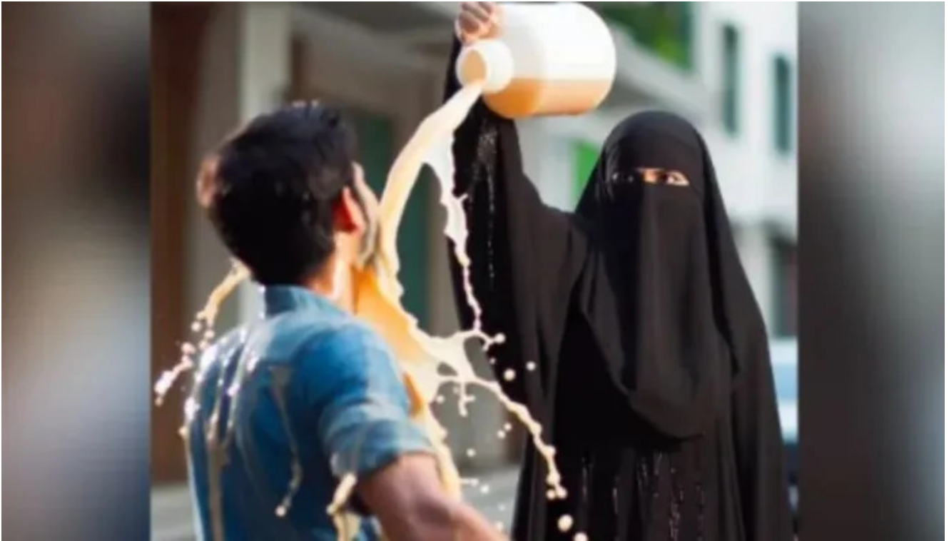
Image d'illustration ► L'attaque à l'acide est courante en islam, par jalousie, vengeance ou pour tuer

...la femme est également accusée d'avoir tenté de le forcer à se convertir à l'islam.