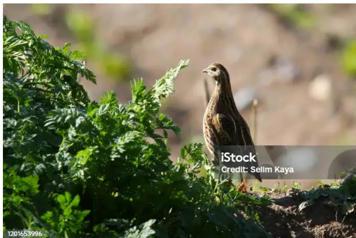
caille des blés