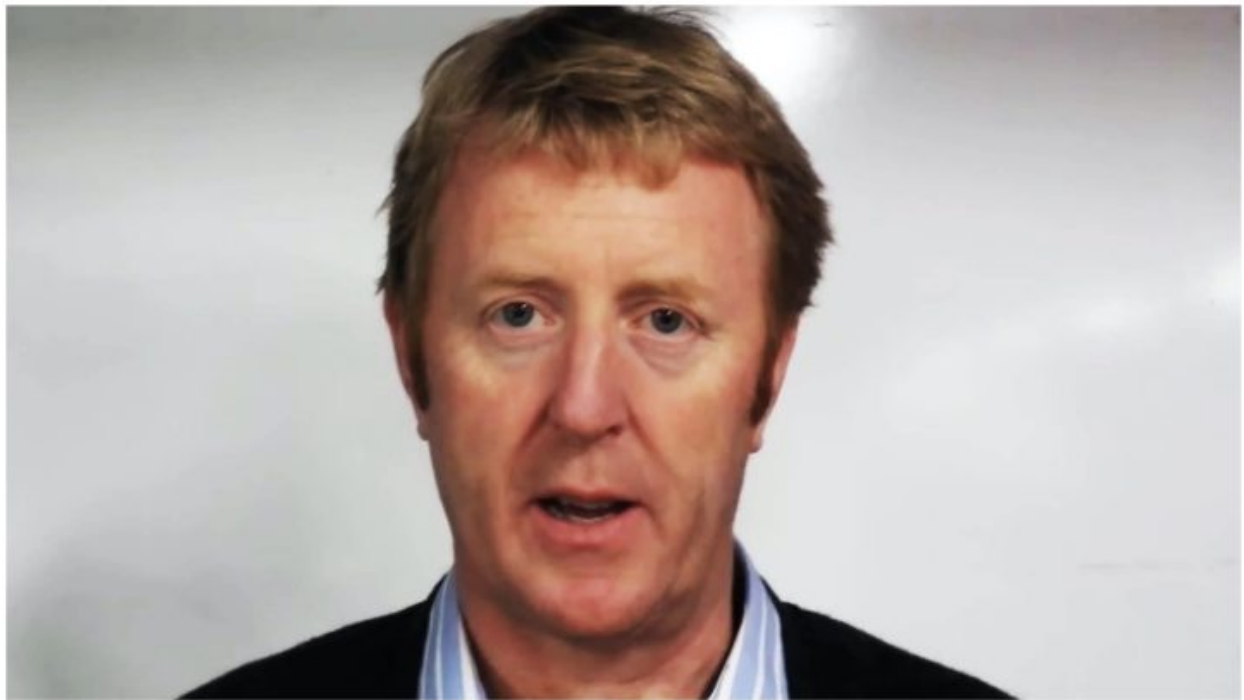
La mort de Mike Dickson, journaliste sportif, ravive les discussions sur ses critiques sans filtre envers Novak Djokovic.