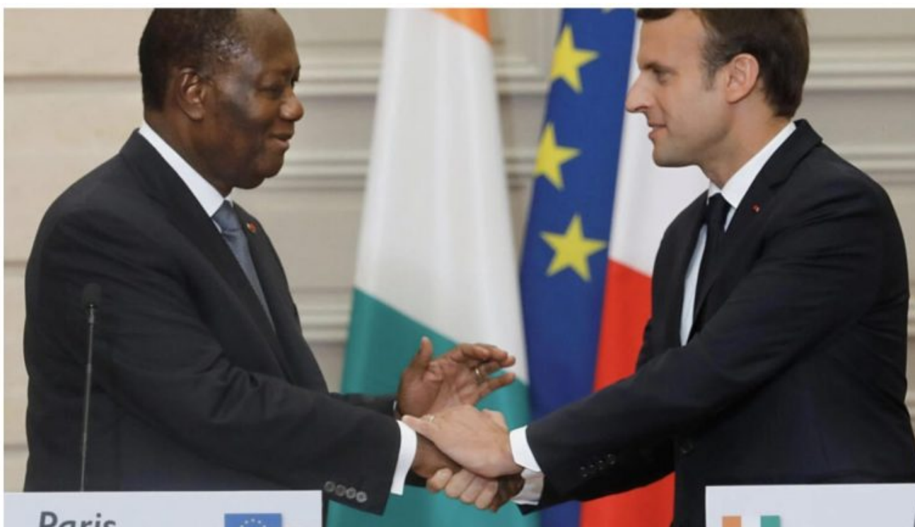
Alassane Ouattara et Emmanuel Macron au palais de l'Élysée, le 11 juin 2017. (image d'illustration)

écrit par Christine Tasin | 18 janvier 2024