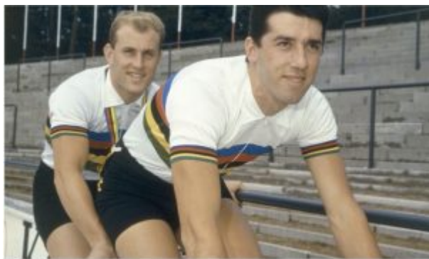
Champions du monde de tandem en 1966, Daniel Morelon et Pierre Trentin ne laisseront aucune chance à leurs adversaires sur le vélodrome de Mexico.

□ Donc, selon vous Pierre Trentin qui, « avec son énergie », a fait « monter l'ambiance » à travers le monde ne pourrait pas « faire monter l'ambiance dans les territoires et mettre la France au diapason de la fête des Jeux » ?