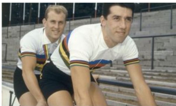
Champions du monde de tandem en 1966, Daniel Morelon et Pierre Trentin ne laisseront aucune chance à leurs adversaires sur le vélodrome de Mexico.

□ Donc, selon vous Pierre Trentin qui, « avec son énergie », a fait « monter l'ambiance » à travers le monde ne pourrait pas « faire monter l'ambiance dans les territoires et mettre la France au diapason de la fête des Jeux » ?