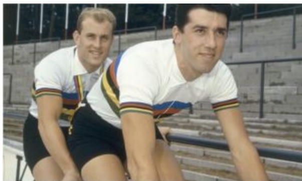
Champions du monde de tandem en 1966, Daniel Morelon et Pierre Trentin ne laisseront aucune chance à leurs adversaires sur le vélodrome de Mexico.

□ Donc, selon vous Pierre Trentin qui, « avec son énergie », a fait « monter l'ambiance » à travers le monde ne pourrait pas « faire monter l'ambiance dans les territoires et mettre la France au diapason de la fête des Jeux » ?