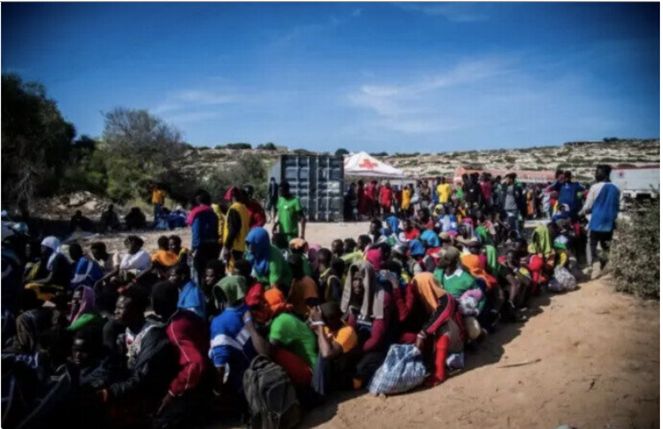
Des immigrés illégaux se rassemblent devant le centre "Hotspot" sur l'île italienne de Lampedusa, le 14 septembre 2023.

Et ce sont dans leur immense majorité des musulmans... Je ne dis pas islamistes mais Afghans, Syriens, Palestiniens ne sont ni des anges ni des chrétiens.