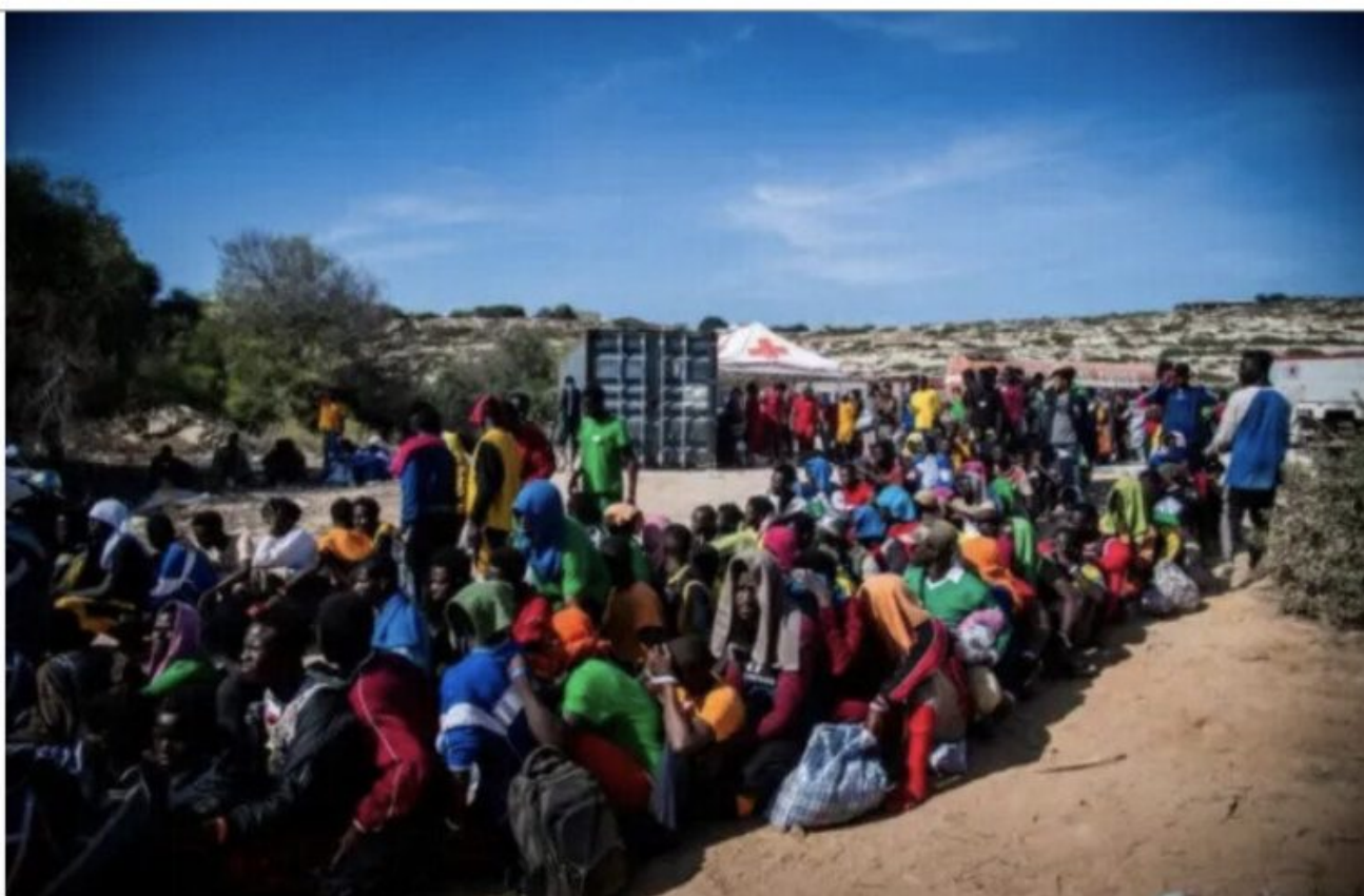
Des immigrants illégaux se rassemblent devant le centre "Hotspot" sur l'île italienne de Lampedusa, le 14 septembre 2023.

écrit par Christine Tasin | 17 janvier 2024