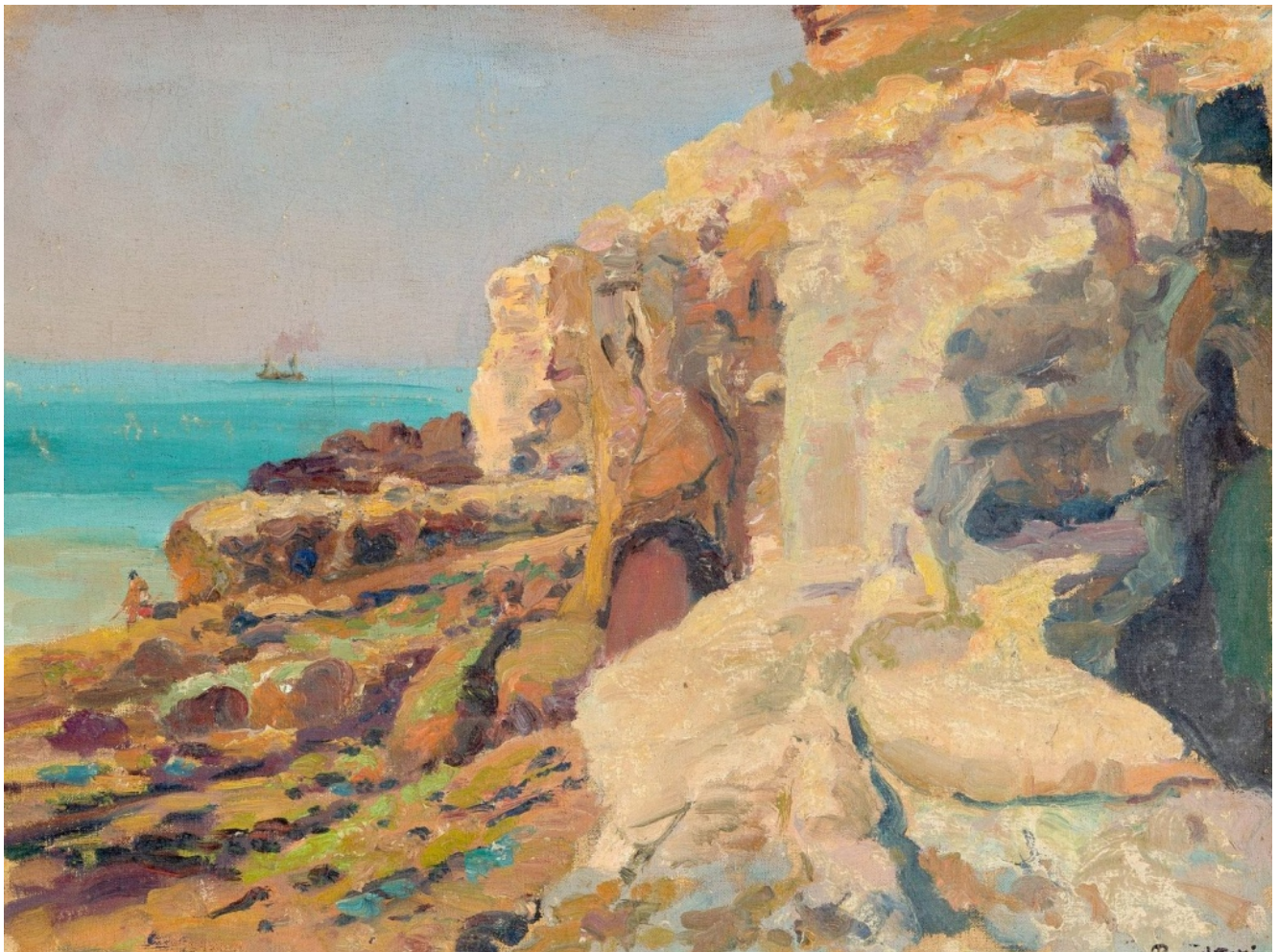
Bord de mer aux pêcheurs à pied

Il pose dès lors à son tour son chevalet devant les bords de mer, normands ou bretons, qu'il dépeint au gré d'une touche enlevée et d'une palette vive, jouant des contrastes entre les couleurs complémentaires.