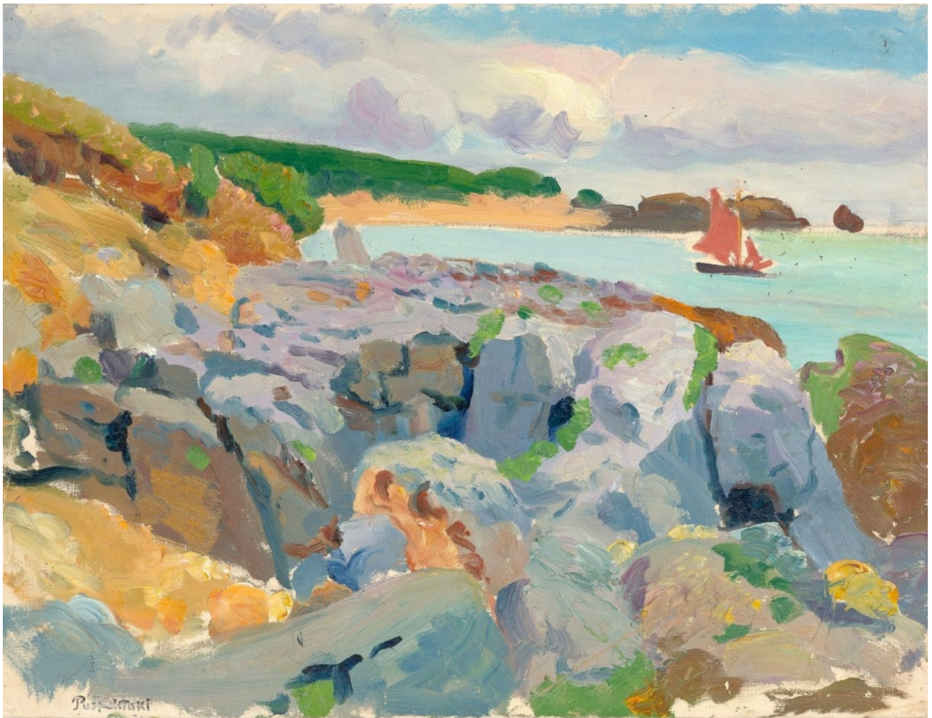
Bord de mer au voilier