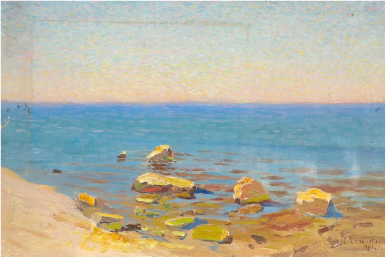
Bord de mer aux rochers, 1904