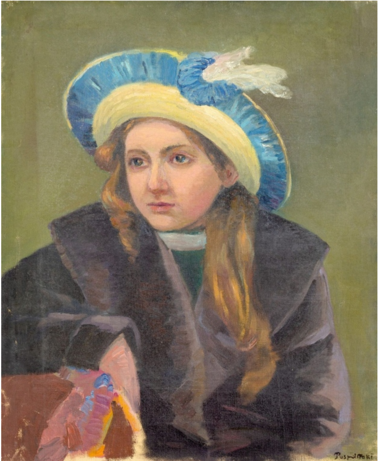
Fillette au chapeau, huile sur toile