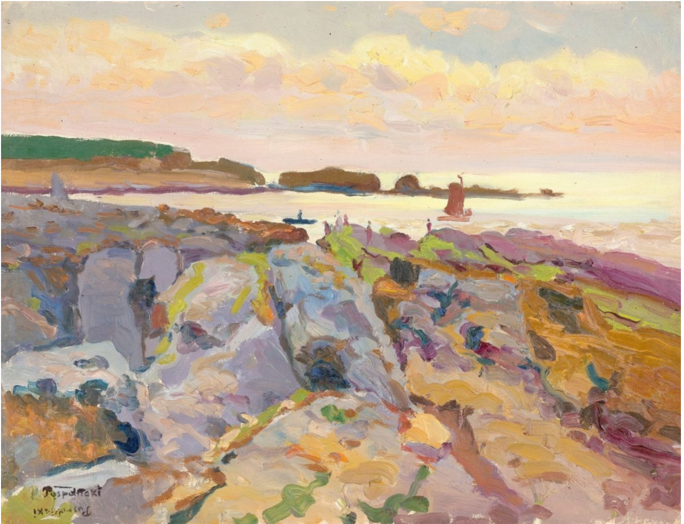
Bord de mer animé

Le 17 janvier à Neuilly-sur-Seine, la maison Aguttes dispersera aux enchères le fonds d'atelier d'Evgeni Ivanovitch Pospolitaki, un peintre russe méconnu qui travailla entre la Russie et la France, de la fin du XIXe au début du XXe siècle.