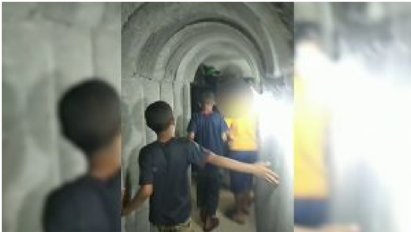
Séquence vidéo montrant des terroristes du Hamas escortant des enfants à travers le tunnel de Gaza.