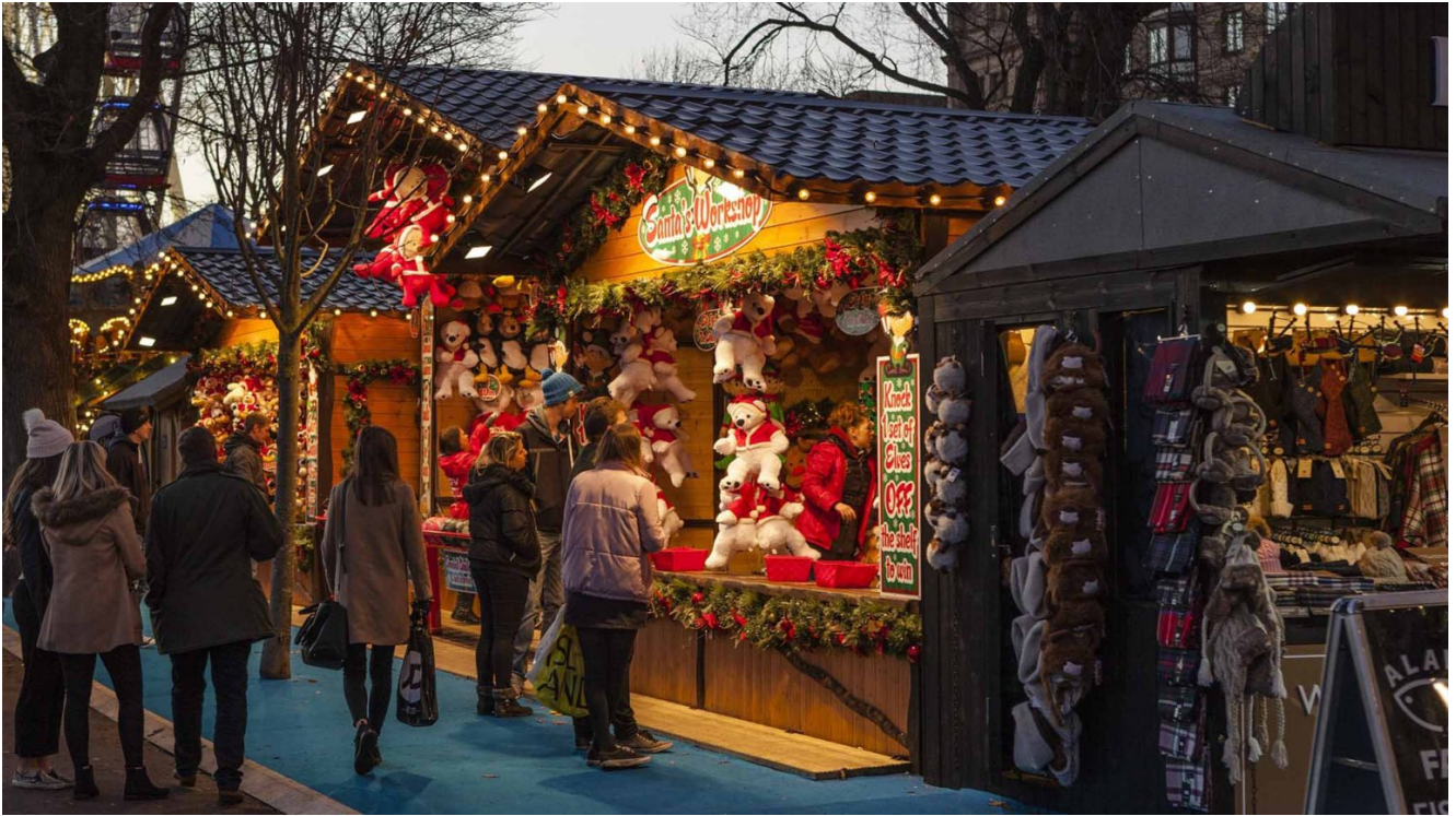
L'ambiance festive à Omsk, Russie