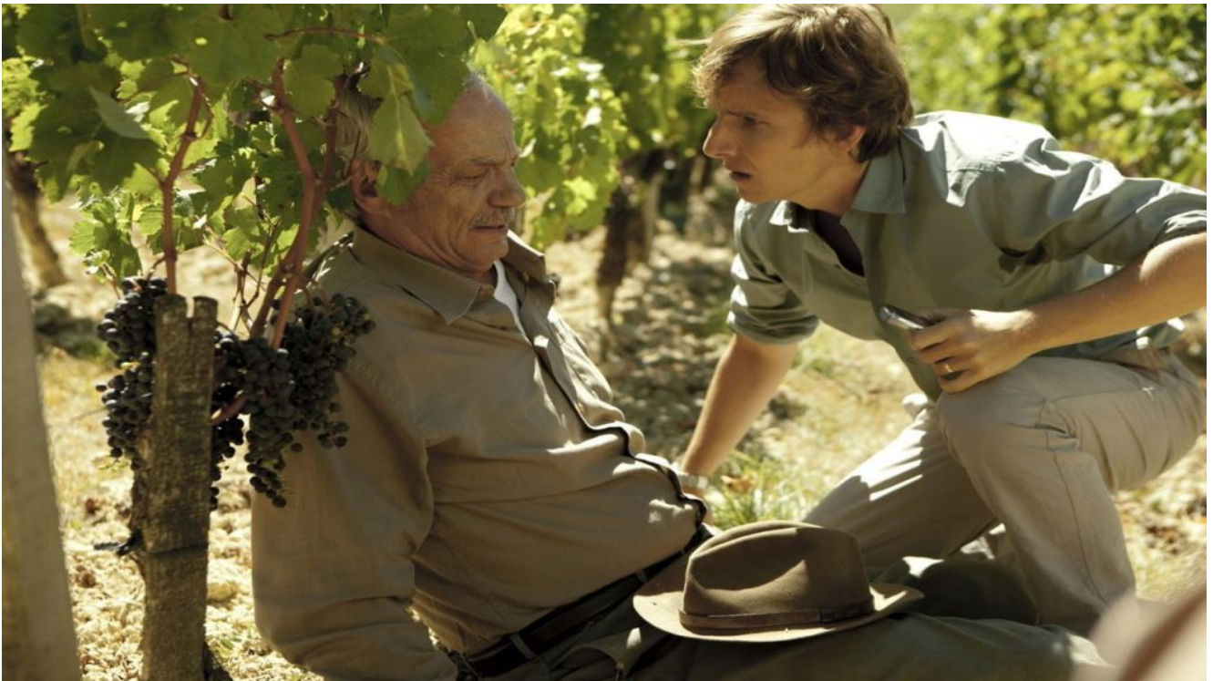
Patrick Chesnais, Lorant Deutsch