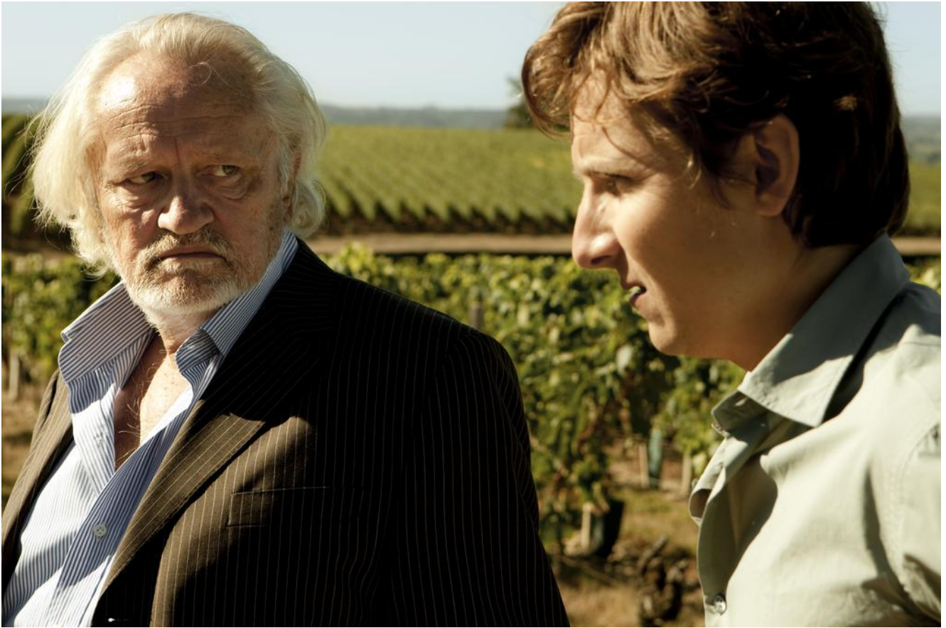
Niels Arestrup, Lorant Deutsch