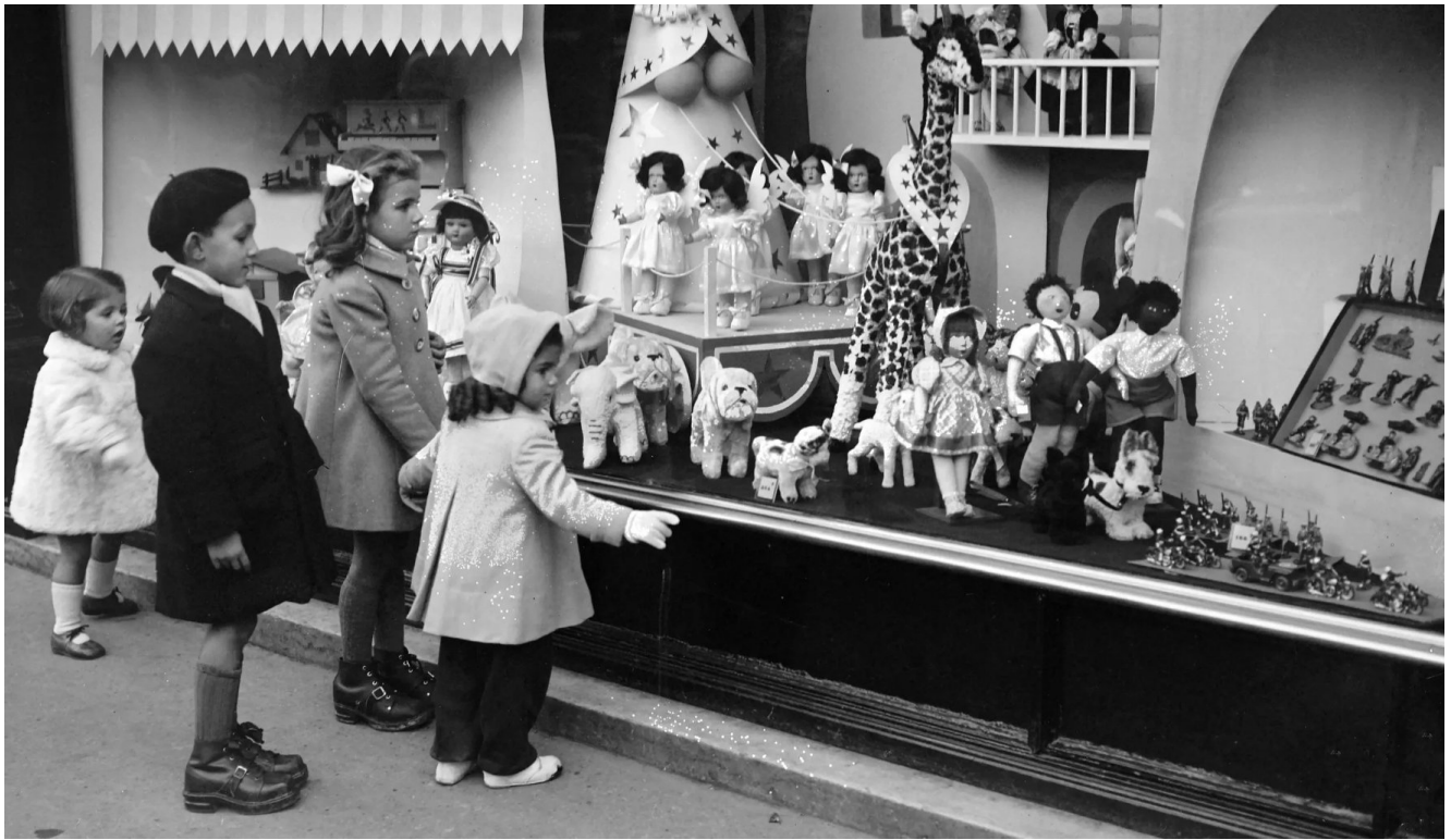
« La vitrine de Noël » – Décembre 1964