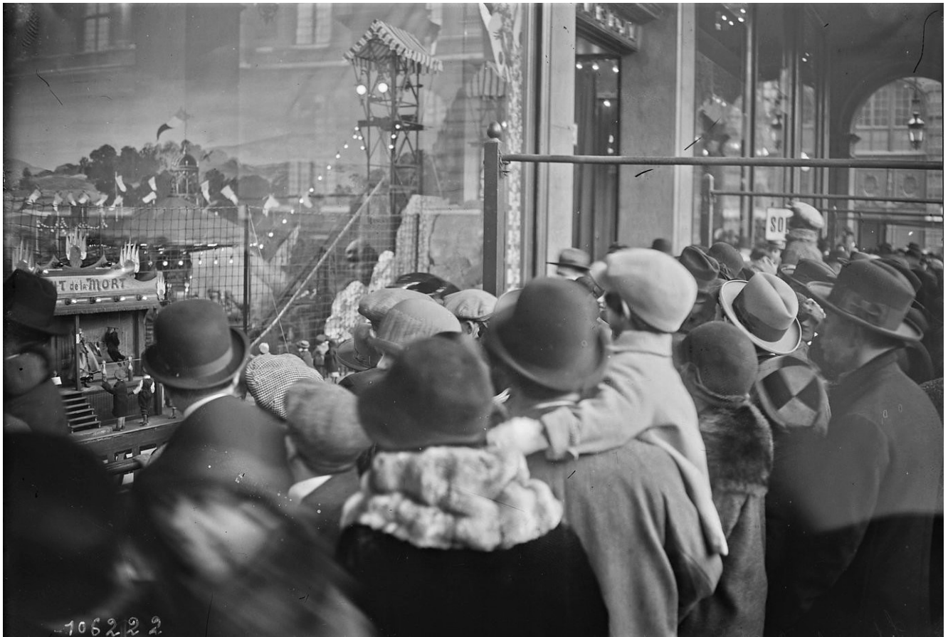
La foule devant les Grands Magasins , vers 1930