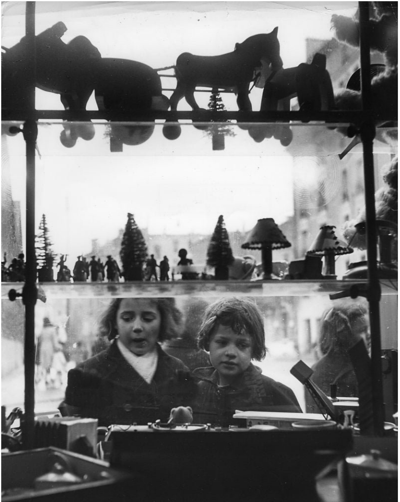
Le Magasin de Jouets 1947