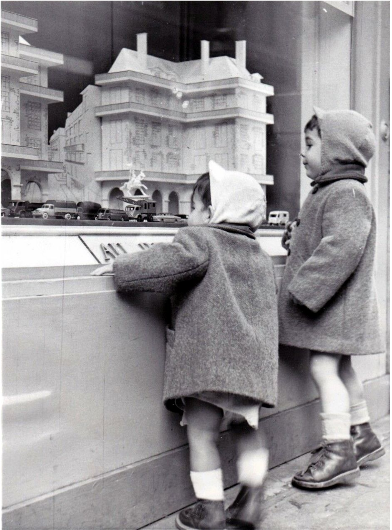
Lèche-vitrine : les voitures, les camions et les autobus !