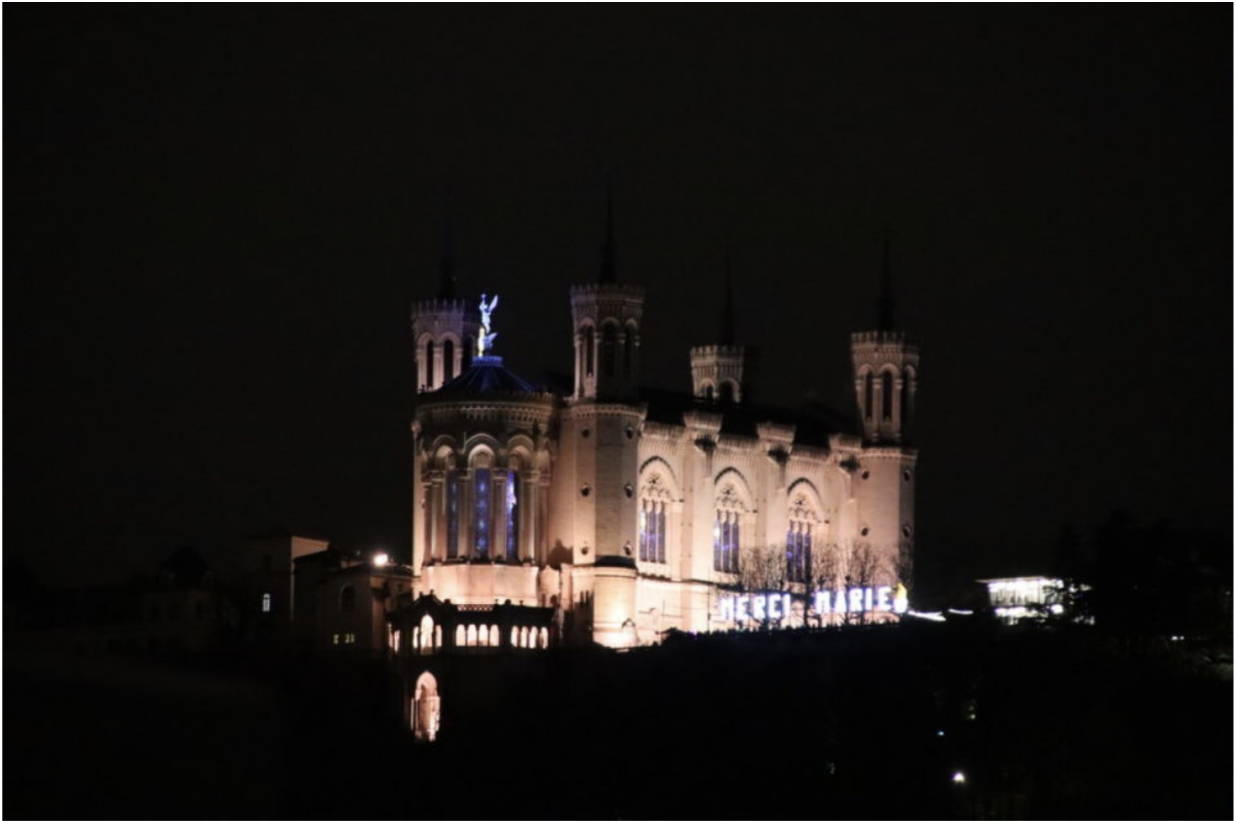
Une procession aux flambeaux du groupe d'ultra-droite Les Remparts devait se tenir le 8 décembre 2023. Elle a été interdite par la préfecture du Rhône.