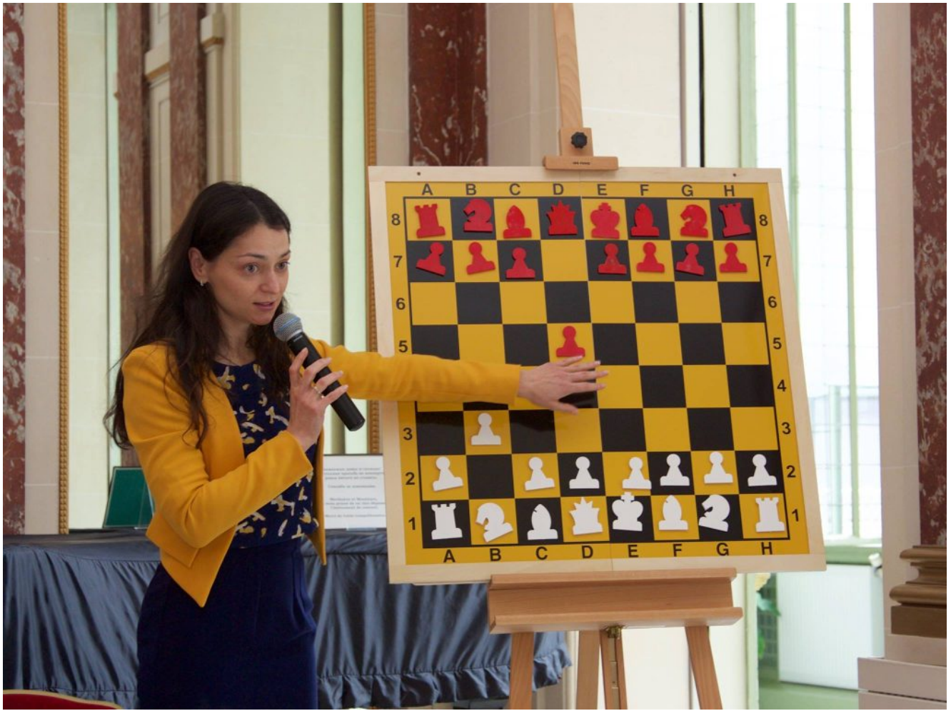
Photo : L'Académie Russe d'Échecs à Paris donne des cours. Ici la 12ème championne du monde Alexandra Kosteniuk