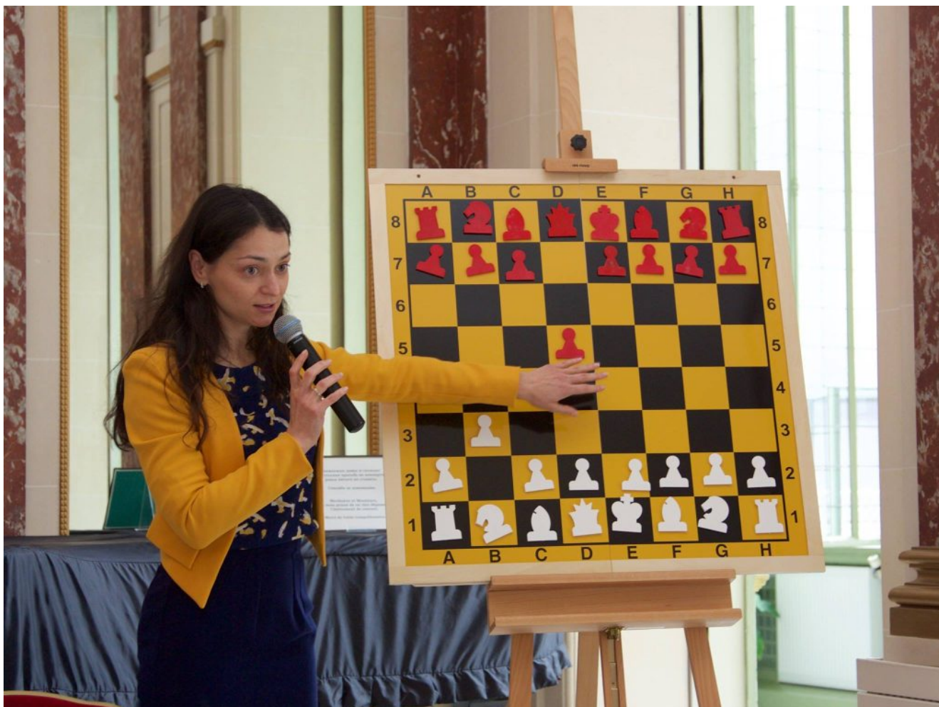
Photo : L'Académie Russe d'Échecs à Paris donne des cours. Ici la 12ème championne du monde Alexandra Kosteniuk