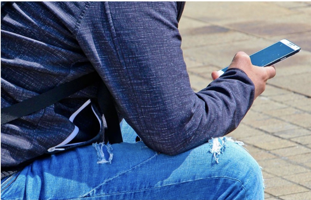
La victime, sourde et muette, venait de se faire voler son portable.