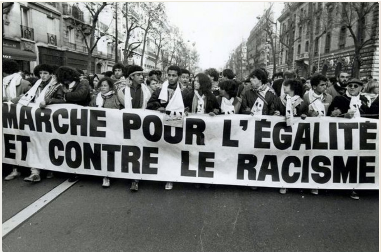
Le 15 octobre 1983 s'élançait une marche non-violente de Marseille à Paris pour l'égalité et contre le racisme. Ici, le rassemblement arrive à Paris. ● © OLIVIER BOITET / MAXPPP