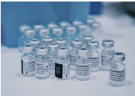
Le vaccin BioNTech/Pfizer, dit Comirnaty, est sur la sellette à propos de ses effets secondaires présumés.

Souffrant des effets secondaires de l'expérimentation médicale appelée improprement « vaccin », l'actrice de 41 ans a choisi le suicide médical assisté en Suisse. Evidemment, les médias aux ordres de mettre en avant un dérangement mental. Ben [...]