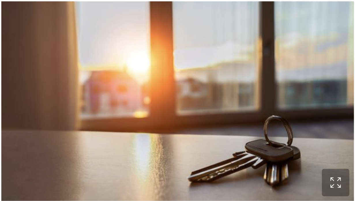
Les deux maisons appartenait au diocèse de Nice.

Le département des Alpes-Maritimes croule-t-il sous les sous, à l'heure où les taxes foncières des propriétaires augmentent plus que significativement et que l'Etat fait payer cher le malheureux qui a une résidence secondaire ?