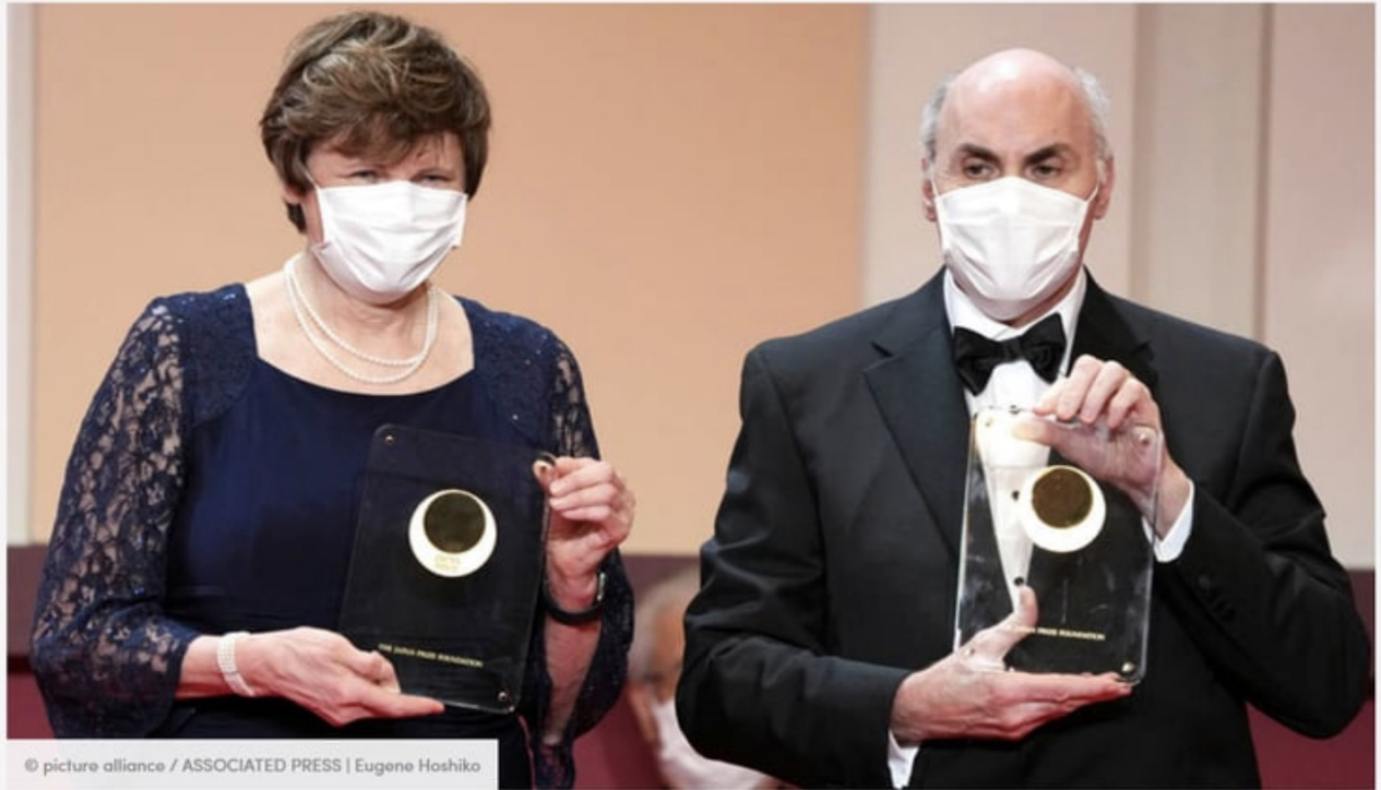
La photo principale de l'article « Prix Nobel de médecine pour le développement de vaccins à ARNm » montre Katalin Karikó et Drew Weissman lors de la cérémonie de remise du Prix Japon le 13 avril 2022 à Tokyo

Même parmi ceux qui ont été « vaccinés » contre le Corona, la nouvelle selon laquelle Katalin Karikó et Drew Weissman ont reçu le prix Nobel de médecine pour leurs recherches sur les injections d'ARNm a dû susciter l'étonnement.