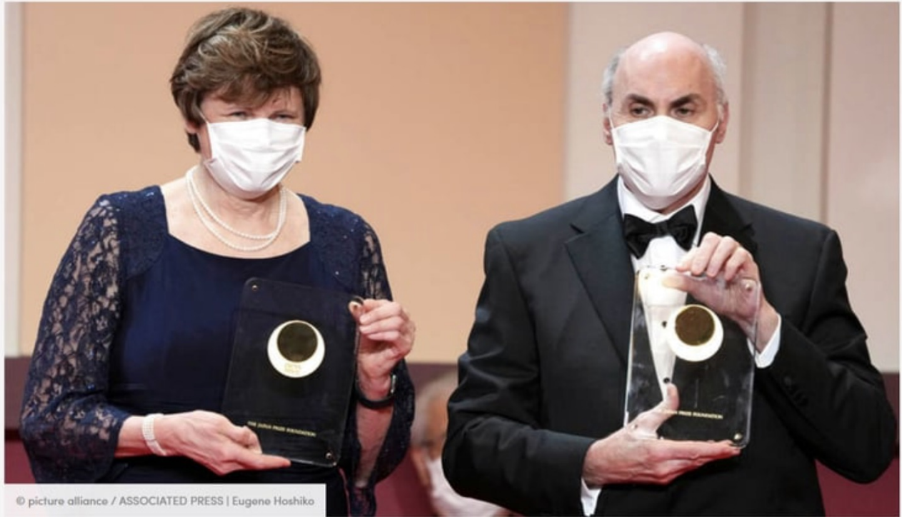
La photo principale de l'article « Prix Nobel de médecine pour le développement de vaccins à ARNm » montre Katalin Karikó et Drew Weissman lors de la cérémonie de remise du Prix Japon le 13 avril 2022 à Tokyo

Même parmi ceux qui ont été « vaccinés » contre le Corona, la nouvelle selon laquelle Katalin Karikó et Drew Weissman ont reçu le prix Nobel de médecine pour leurs recherches sur les injections d'ARNm a dû susciter l'étonnement.