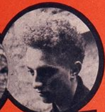
ELEK JUIF HONGROIS 8 DÉRAILLEMENTS