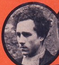
WITCHITZ JUIF POLONAIS 15 ATTENTATS