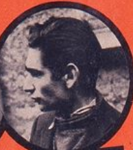
FINGERWEIG JUIF POLONAIS 3 ATTENTATS - 6 DÉRAILLEMENTS