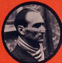
BOCZOJ JUIF HONGROIS CHEF DÉRAILLEUR 20 ATTENTATS