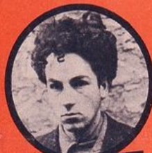
WASJBROT JUIF POLONAIS 1 ATTENTAT - 3 DÉRAILLEMENTS