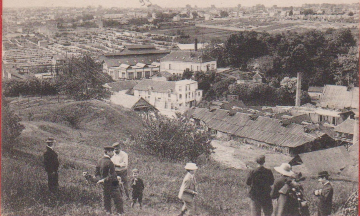
941. MONTREUIL-sous-BOIS - La Fabrique de Plâtre et le Clos des Pêches E. M.