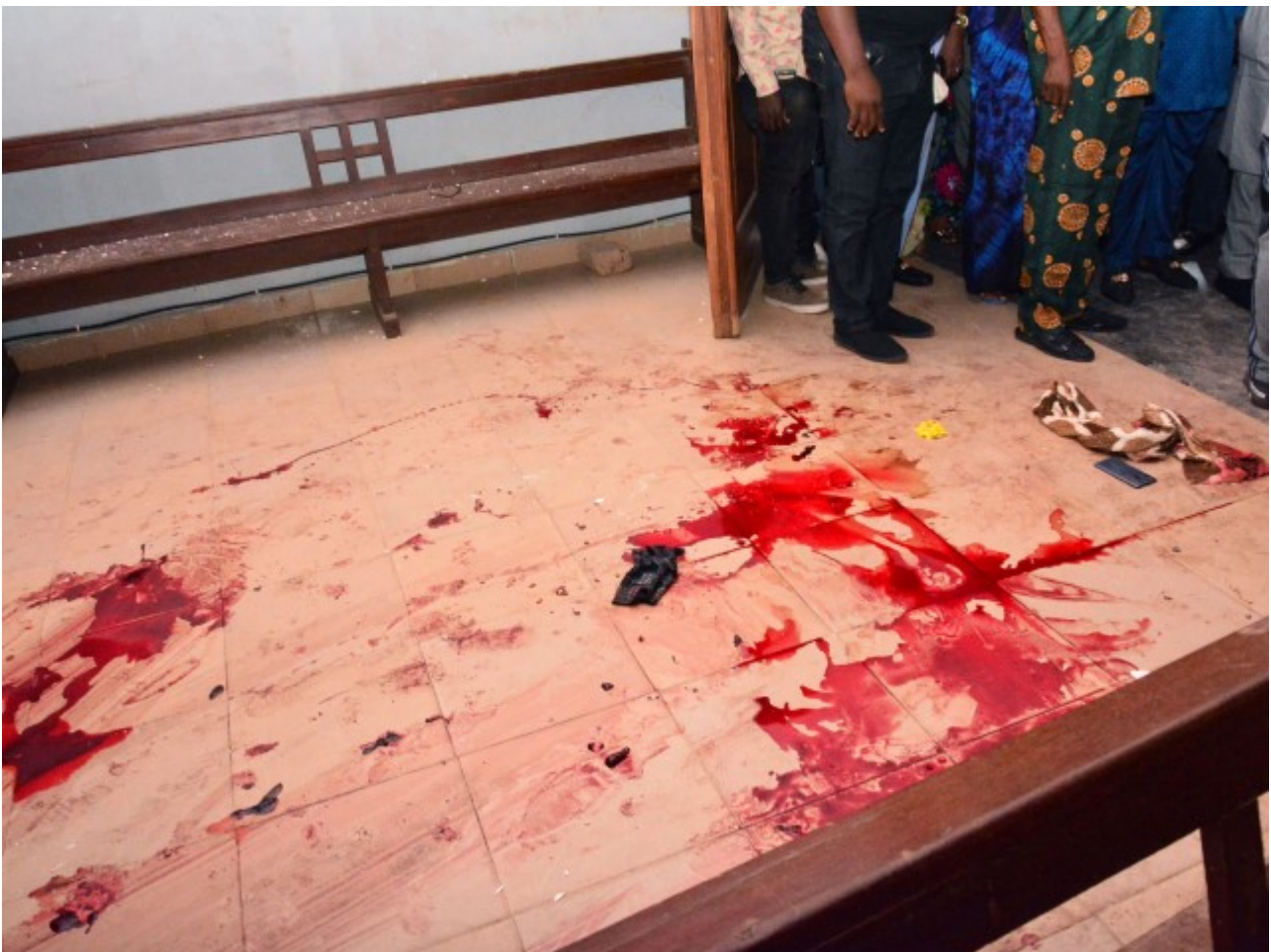
Illustration. Des personnes se tiennent près du sol taché de

Les chrétiens du Nigeria “sont persécutés en raison d'un programme d'islamisation forcée, qui est particulièrement répandu dans le nord du pays et qui s'étend progressivement vers le sud”, selon un rapport publié en janvier dernier par le groupe de surveillance chrétienne Open Doors (Portes ouvertes).