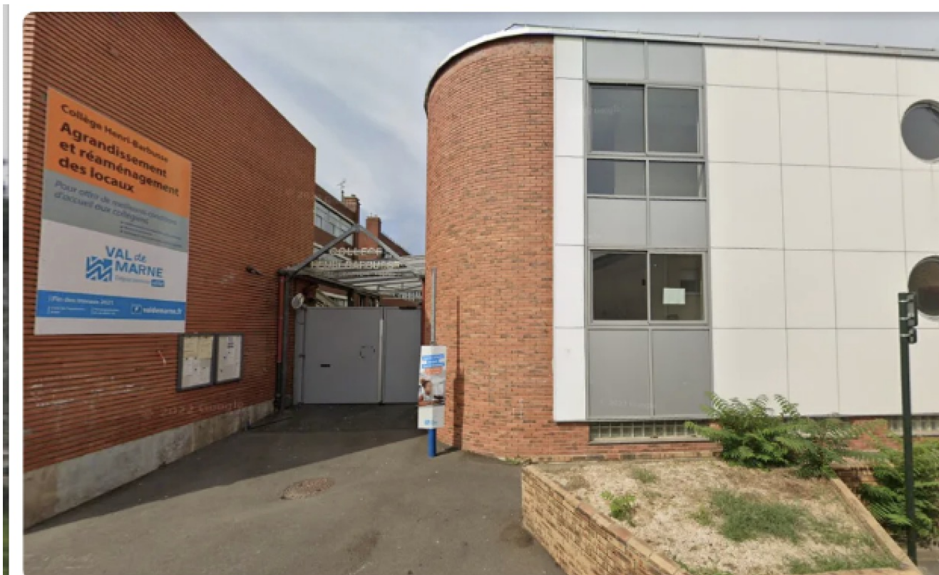
Capture Google maps Un adolescent de 14 ans a été interpellé en plein cours au collège Henri-Barbuse à