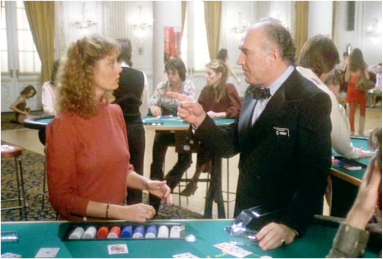
On aperçoit Michel Piccoli en patron de casino.