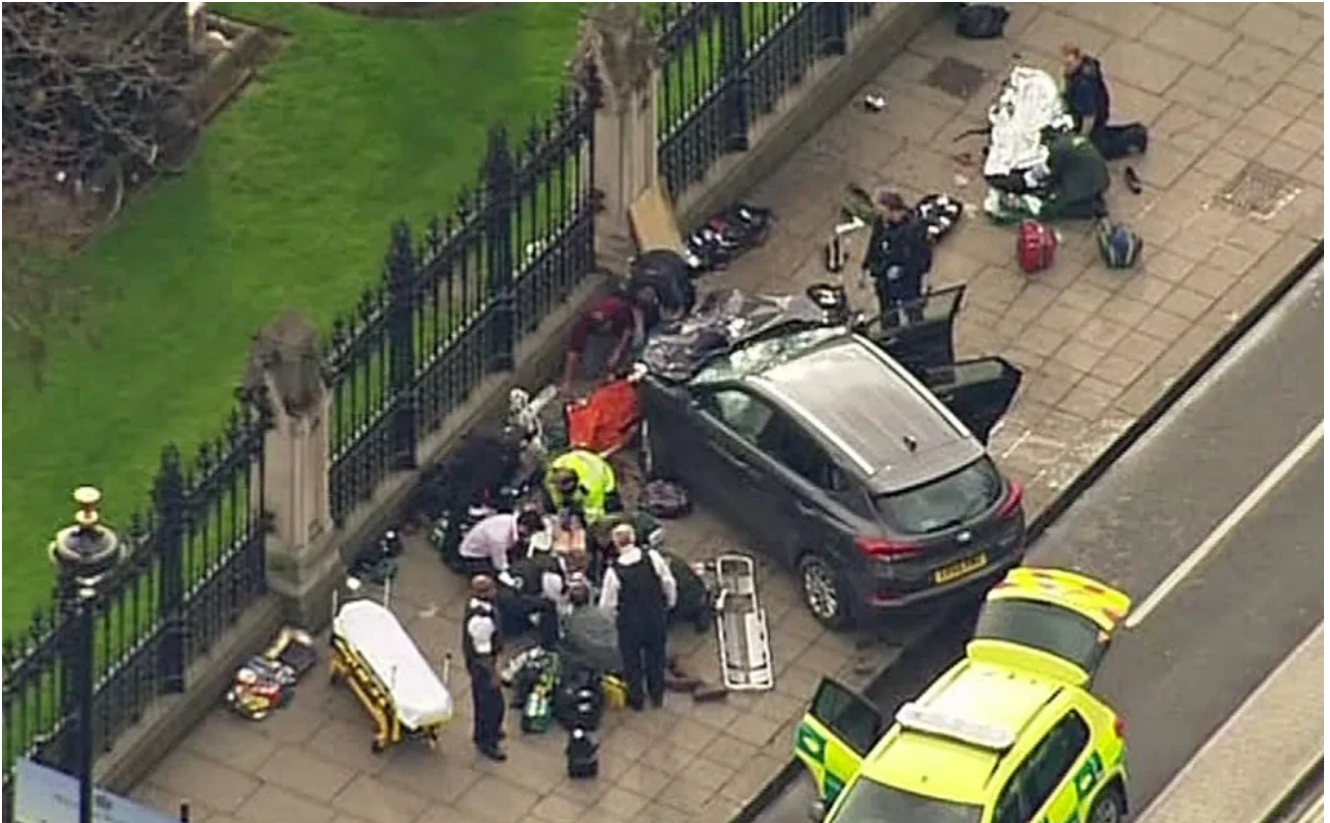
2017, la terreur islamiste frappe au cœur de Londres, une voiture fonce dans la foule (Attentat de Westminster)