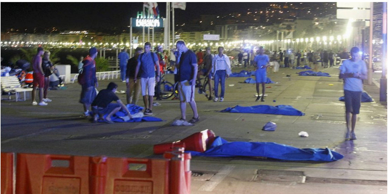
Carnage au nom de l'islam, 14 juillet à Nice

Rudy's Pizzeria, l'Albert Hall [salle de concert] et le bar