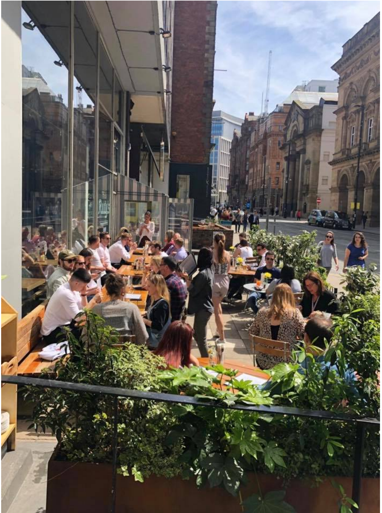
Terrasse de la Rudy's Pizzeria