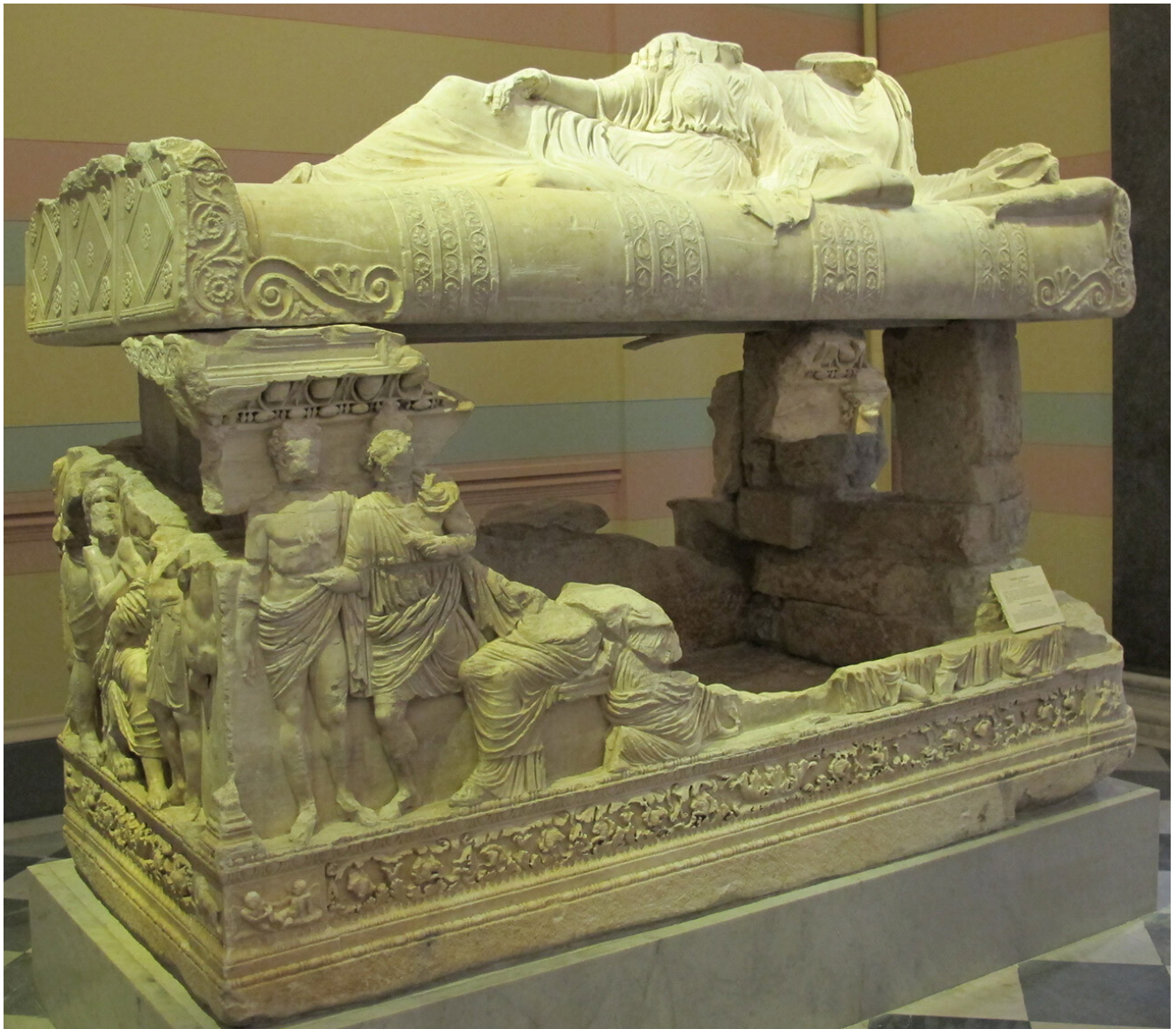
Le sarcophage de Myrmekion dans la collection de l'Ermitage