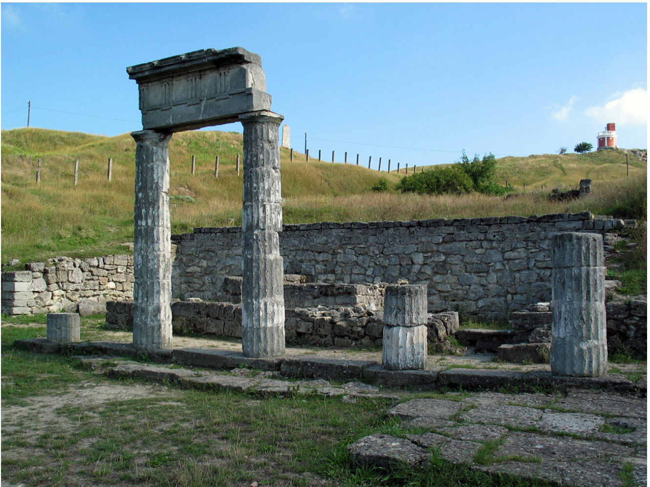
Les ruines de l'antique Panticapée à Kertch