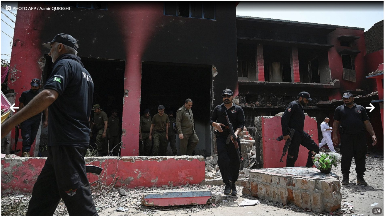
Des policiers inspectent l'église incendiée de l'Armée du Salut, à Jaranwala au Pakistan le 17 août 2023

Le titre de l'article suivant laisse sans doute à peu près indifférents la plupart des Français d'origine, pensant que tout cela relève de la barbarie musulmane dans des pays barbares et que nous serions à l'abri.