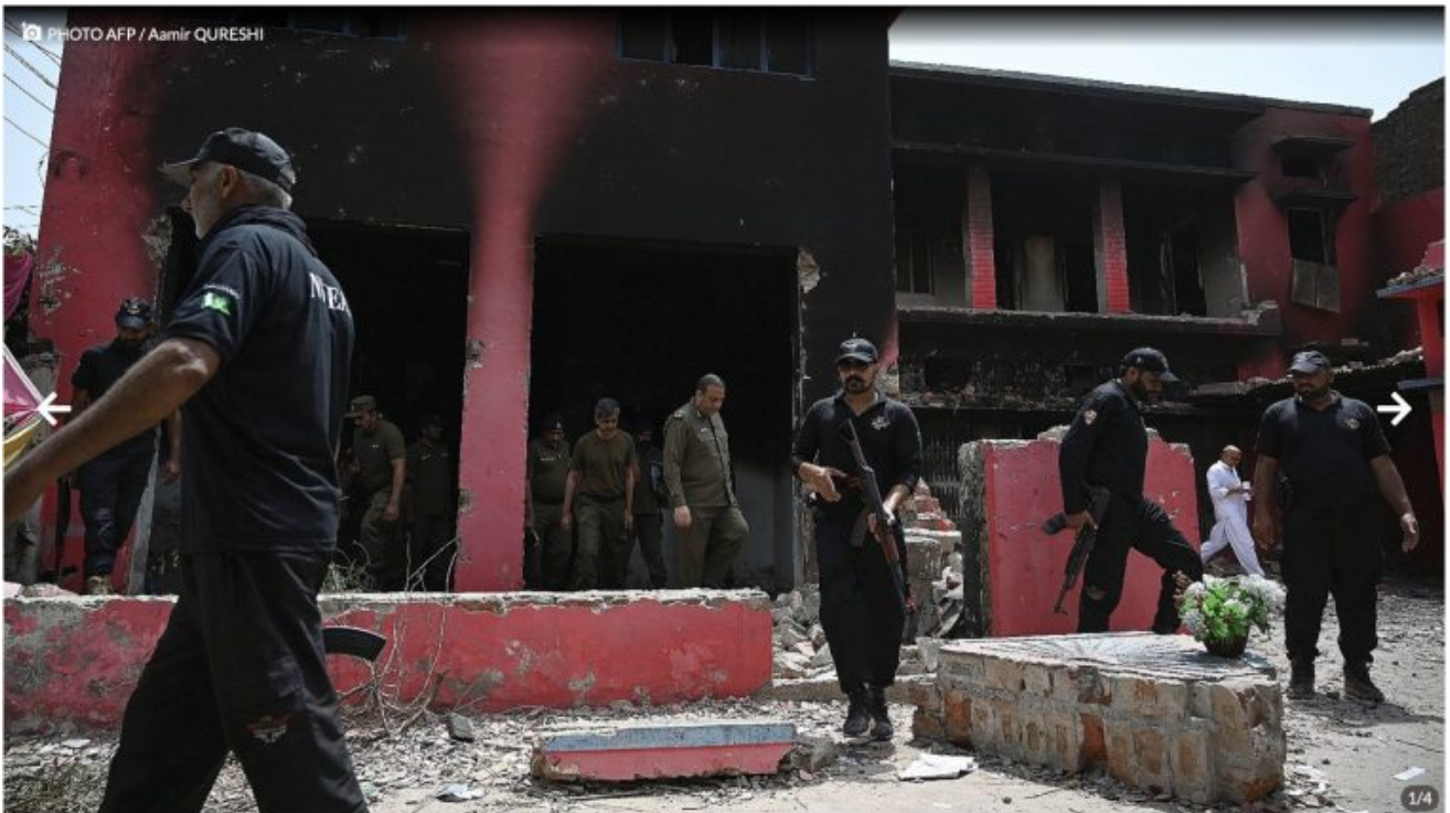
Des policiers inspectent l'église incendiée de l'Armée du Salut, à Jaranwala au Pakistan le 17 août 2023

écrit par Christine Tasin | 18 août 2023