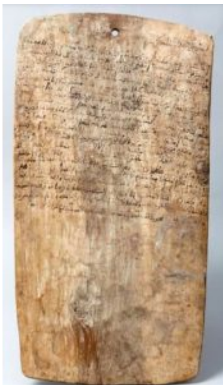
Tablette coranique qui ressemble étrangement au visage de Bazoum

Le Macron est-il plus légitime que le Bazoum ?