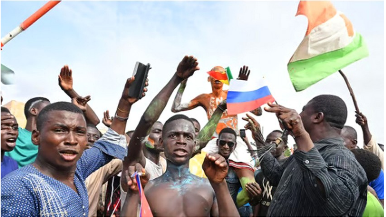
Manifestation de Nigériens en soutien aux putschistes

Les trois quarts des Nigériens, soit 78% exactement, soutiennent les putschistes qui ont fait chuter le Mohamed Bazoum.