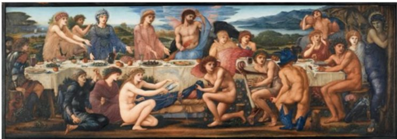
Mariage d'Eris et de Pélée - Bume-Jones - tous les regards sont tournés vers Eris - en bleu à droite - qui vient de lancer sa pomme de discorde au milieu des convives. Déjà les déesses se moquent désignées par ce choix malicieux.

écrit par Christine Tasin | 11 août 2023