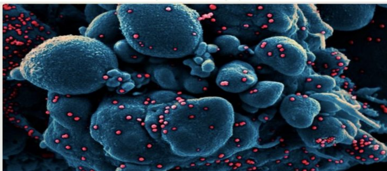
Le nouveau sous-variant "Eris" circule déjà dans plusieurs pays comme la France, où les infections au Covid sont reparties à la hausse.