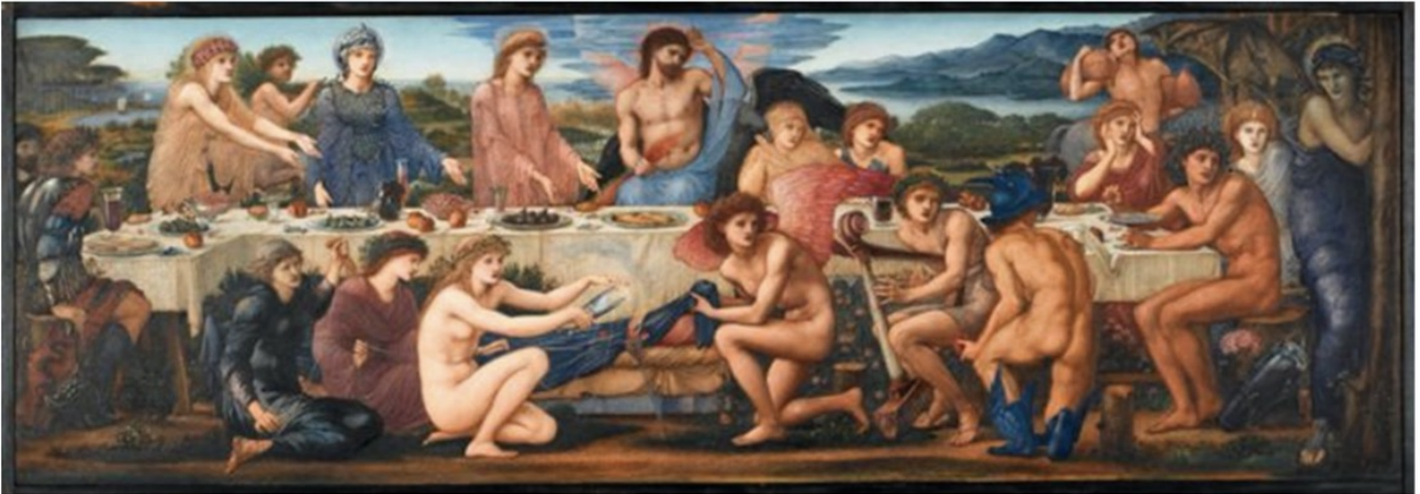
Mariage d'Eris et de Pélée - Bume-Jones - tous les regards sont tournés vers Eris - en bleu à droite - qui vient de lancer sa pomme de discorde au milieu des convives. Déjà les déesses se mortrent désignées par ce choix malicieux.